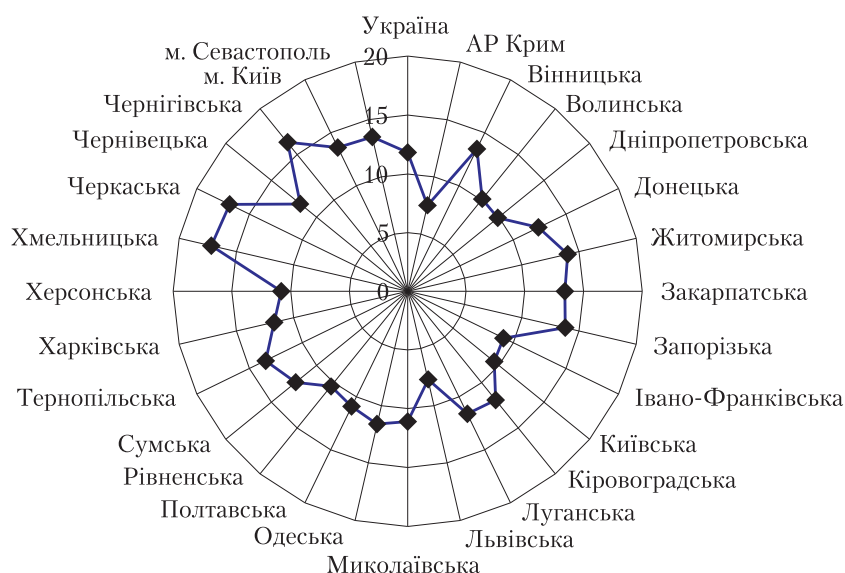
Рис. 1. Самооцінка стану здоров'я населення, %, 2008 р.