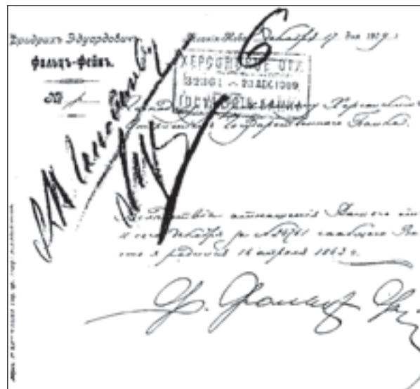
Документальне підтвердження дати народження Фрідріха Фальц-Фейна

опубліковано в повідомленнях Бориса Сергійовича Скадовського [23, 24], а також у книзі німецької дослідниці Аніти Маасс [25], яка співпрацювала з ним.