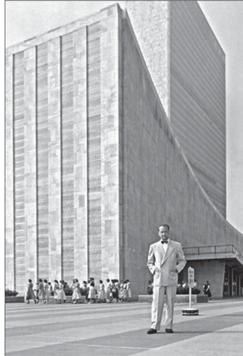
Даг Хаммаршельд біля будівлі ООН

Це була перша в історії миротворча операція під командуванням ООН, основана на принципах, сформульованих Хаммаршельдом, — опе-