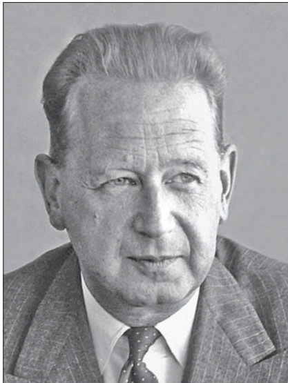
Даг Яльмар Агне Карл Хаммаршельд (Dag Hjalmar Agne Carl Hammarskjöld)

відстоювати свої переконання». Батько Дага був професором юриспруденції, спеціалізувався з питань міжнародного права, брав участь у Другій Гаазькій конференції з міжнародного права (1907), що наклало відбиток на кар'єру його дітей: у майбутньому міжнародним правом займалися і сам Даг, і два його старших брати.