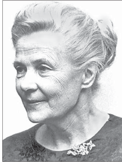
Альва Мюрдаль (Alva Myrdal)

У 1934 р. Альва Мюрдаль здобула ступінь магістра в Уппсальському університеті. Тоді ж разом із чоловіком вона опублікувала спільне дослідження «Криза в проблемі населення» («Kris i befolkningsfragan»), яке принесло авторам міжнародне визнання. У 30-х роках шведські соціал-демократи досягли в суспільстві такого впливу, що мали змогу здійснити основні соціальні реформи. Книга подружжя Мюрдаль підказувала уряду, що слід забезпечувати благополуччя всіх дітей, незалежно від фінансового стану їхніх батьків. Альву запросили на роботу до урядового комітету із забезпечення житлом і призначили радником Королівської комісії з питань населення, а рік по тому вона заснувала Педагогічний інститут дошкільного навчання і була його директором до 1948 р. Здобувши репутацію прихильниці прогресивних педагогічних методів, Мюрдаль була членом багатьох національних комітетів і комісій, зокрема з реформи освіти, післявоєнного розвитку, з питань біженців тощо. Вона також стала головою тимчасової комісії Всесвітньої ради з дошкільної освіти. У 1938–1947 рр. була віце-президентом Міжнародної федерації ділових і працюючих жінок. У роки Другої світової війни Альва Мюрдаль як відомий член СДПШ відіграла провідну роль у розвитку руху за політичну та економічну рівність шведської жінки, причому вона прагнула