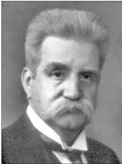
Карл Ялмар Брантінг (Karl Hjalmar Branting)

Навчався в університетах Уппсали і Стокгольма. Здобувши освіту з математики і астрономії, працював помічником директора Стокгольмської обсерваторії. Ще в студентські роки він захоплювався ліберальною політичною філософією і в 1884 р. остаточно залишив наукову стезю, присвятивши себе журналістиці.