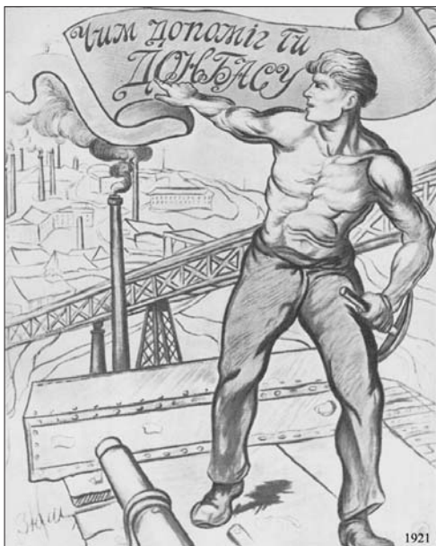
Плакат радянських часів «Чим допоміг ти Донбасу». 1921 р.

базу становлять результати опитувань, проведених Інститутом соціології НАН України, Київським міжнародним інститутом соціології, Соціологічною службою «Ukrainian Sociology Service», Соціологічною службою Центру Разумкова, Фондом «Демократичні ініціативи імені Ілька Кучеріва».