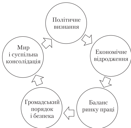
Складові цілеспрямованої роботи задля відновлення Донбасу

Відродження Донбасу потребує цілеспрямованої систематичної і системної роботи владних структур, широкого залучення громадянського суспільства, міжнародних організацій. Необхідно максимально опрацювати накопичений у різних країнах досвід, по можливості адаптувати його і використати в Україні.