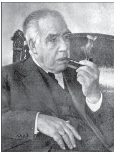
Нильс Хенрик Давид Бор (1885—1962)