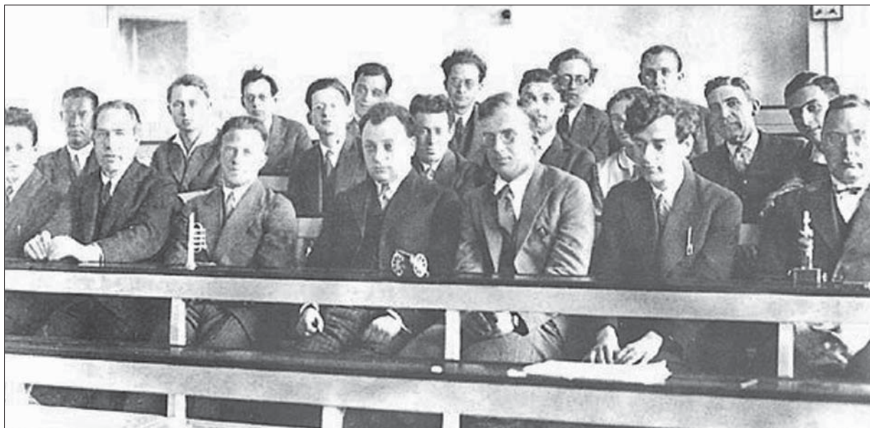
Семинар в Институте Нильса Бора; в первом ряду: О. Клайн, Н. Бор, В. Гейзенберг, В. Паули, Г. Гамов, Л. Ландау, Г. Крамерс. 1930 г.

Нужно заметить, что этот том издан в 1933 г., а большинство работ Ландау относится к периоду после 1933 г.» [2, с. 415].