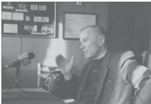
Під час інтерв'ю. 2013 р.