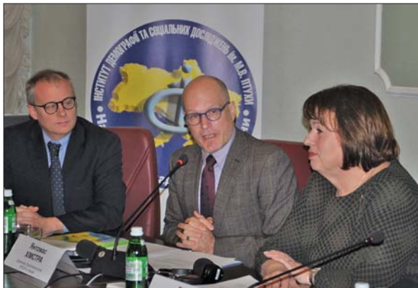
Виступ директора представництва ПРООН в Україні Янтomas Хімстри

підкреслив, що минуло вже 25 років від часу представлення першої доповіді про людський розвиток, що започаткувало новий підхід для просування ідеї добробуту людини. Розвиток людського потенціалу має на меті збільшення багатства людського життя, а не просто багатства країни, в якій ці люди живуть. За останні чверть століття вдалося значно зменшити кількість людей, що проживають в умовах низького рівня людського розвитку, і тепер, щоб закріпити цей прогрес, необхідно зосередити увагу на питаннях праці.