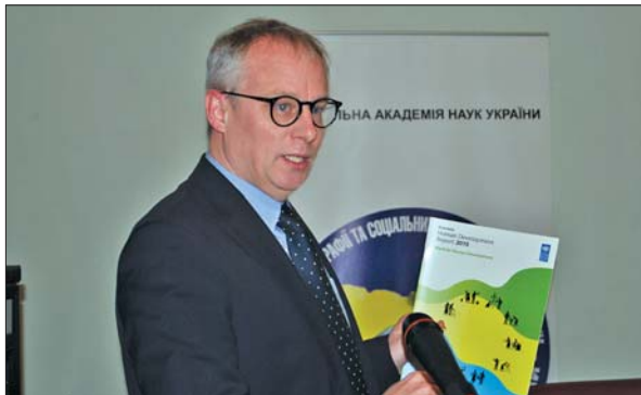
Виступ радника з питань демократичного врядування ПРООН в Україні Маркуса Бранда

ся, якщо робота буде доступною для всіх людей, зокрема для молоді, меншин і корінного населення, осіб з обмеженими можливостями тощо. Доповідь містить заклик до зменшення тягаря неоплачуваної роботи для жінок та розширення їх можливостей щодо оплачуваної роботи. Досягти цього можна завдяки зрівнянню в оплаті праці, запровадженню гнучких графіків роботи, введенню батьківських відпусток та іншим заходам.