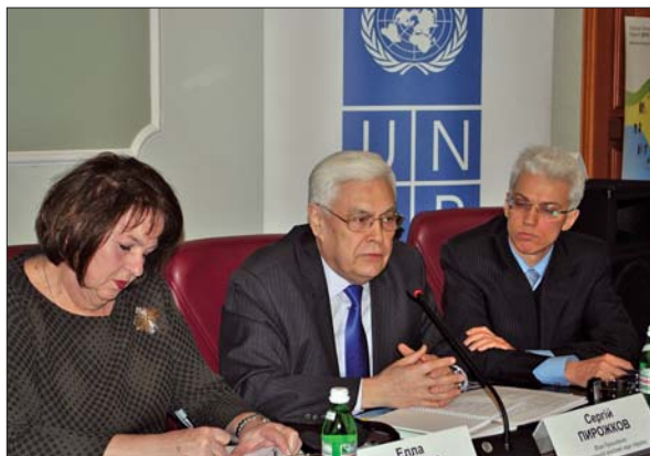
Виступ віце-президента НАН України академіка НАН України Сергія Івановича Пирожкова

3. Робота має сприяти сталості з розширенням можливостей як нинішнього, так і майбутнього поколінь. Підхід до користування природними ресурсами за принципом «звичайного ходу діяльності» наражає на небезпеку прийдешні покоління. Глобальні заходи з розвитку на основі низького рівня викидів і стійкості до змін клімату є критично важливими для розширення можливостей гідної праці. Це потребує політики, спрямованої на створення нових робочих місць, змінення деяких видів діяльності, а в окремих випадках і їх ліквідацію, але з гарантією відповідного соціального захисту. У доповіді рекомендовано інвестувати