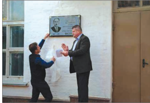
Відкриття меморіальної дошки академіку О.В. Фоміну

Останнім часом значно активізувався інтерес дослідників до постаті О.В. Фоміна. Вийшли друком цікаві наукові розвідки, присвячені