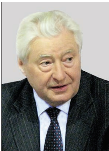
УМАНЕЦЬ Михайло Пантелійович — екс-голова Державного комітету України з використання ядерної енергії (1992–1996 рр.)