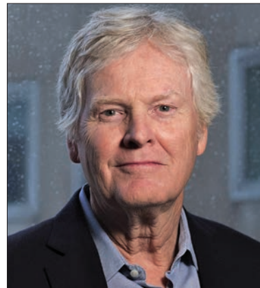
Майкл Янг (Michael W. Young)