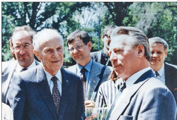
Візит до КБ «Південне» президента НАН України академіка Б.Є. Патона. 1992 р.

Ставши біля керма КБ «Південне», С.М. Конохов зміг не просто утримати підприємство «на плаву», а й забезпечити йому можливість успішно рухатися вперед.