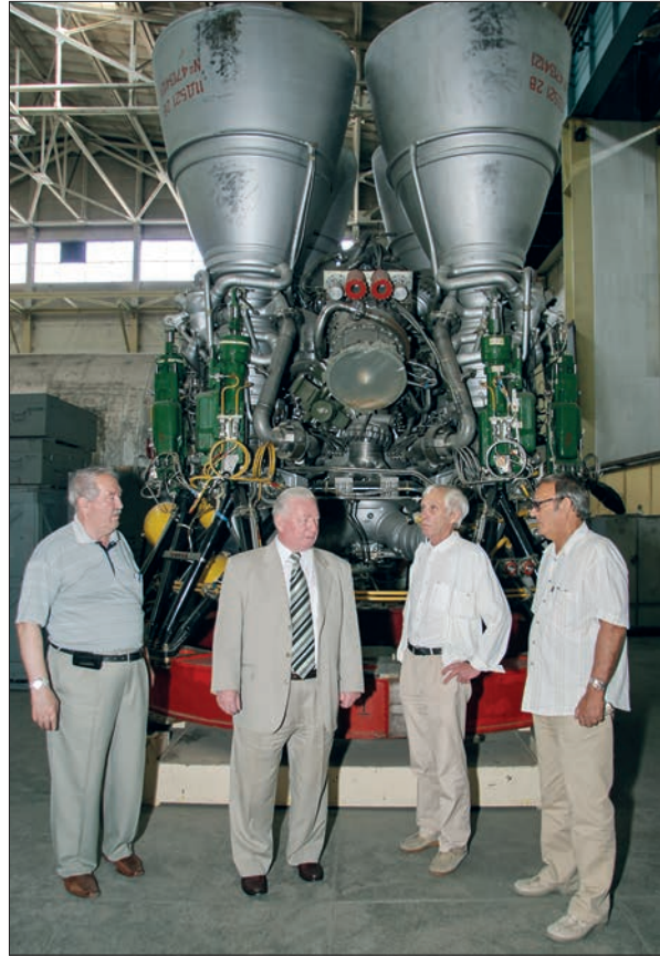
Біля двигуна першого ступеня ракети-носія «Зеніт»

Основним завданням для керівництва КБ «Південне» став пошук і формування замовлень для завантаження виробничих потуж-