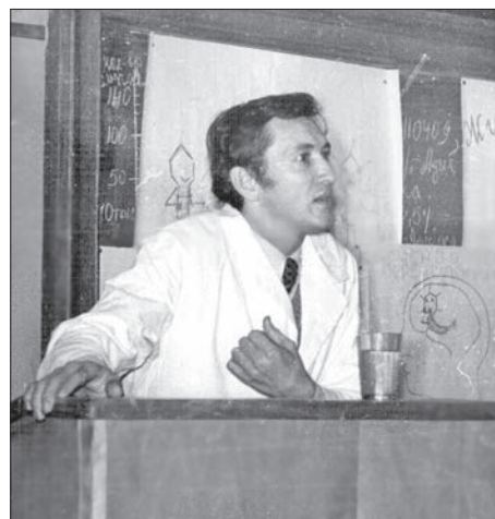
Перші лекції. 1970-ті роки