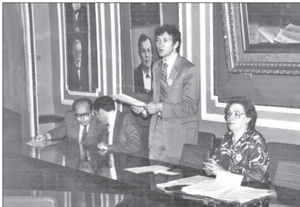
Виїзне засідання Центральної навчально-методичної комісії з мікробіології при МОЗ СРСР. Київський медичний інститут. 1983 р.