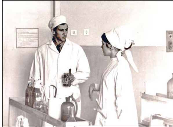
Перші викладацькі роки. 1966 р.