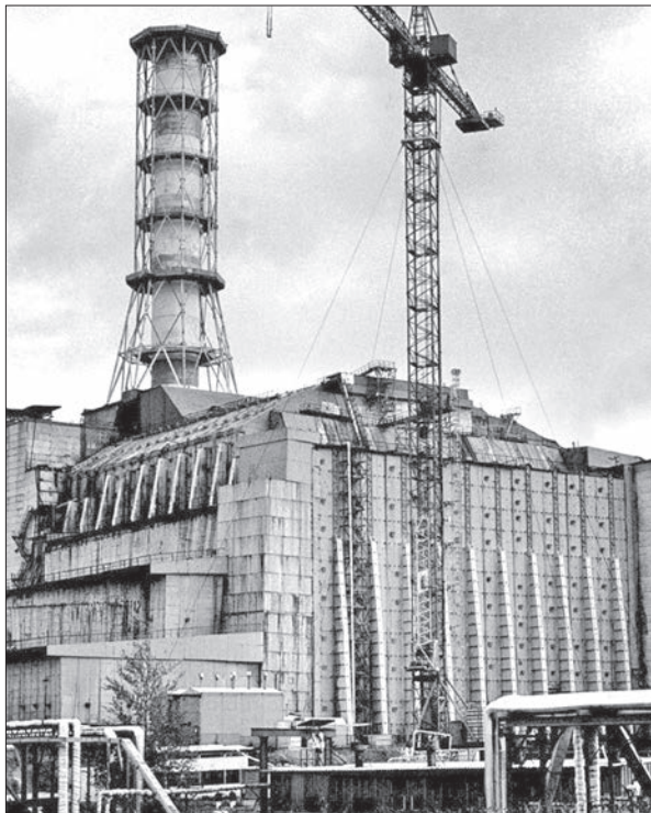
Законсервованій енергоблок № 4 Чорнобильської АЕС — об'єкт «Укриття»

встановлення місцезнаходження залишків ядерного палива, створення систем безпеки, діагностичних та експлуатаційних систем, визначення кількості ядерного палива, дослідження нестійких будівельних конструкцій аварійного енергоблока, розроблення стратегії перетворення об'єкта «Укриття» на екологічно безпечну систему та ін. [4].