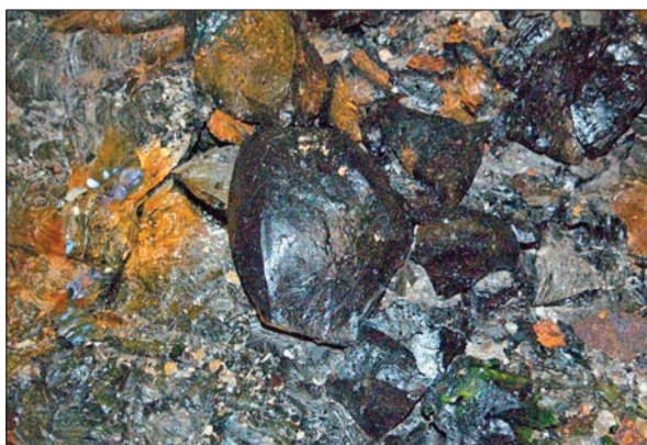
Деградація паливовмісних матеріалів на об'єкті «Укриття»

периментів, побудови аналітичних моделей і розрахунків.