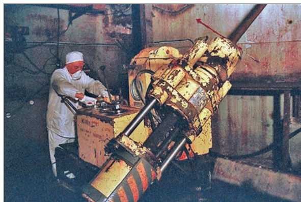
Наукові співробітники ІПБ АЕС виконують роботи в приміщеннях об'єкта «Укриття»