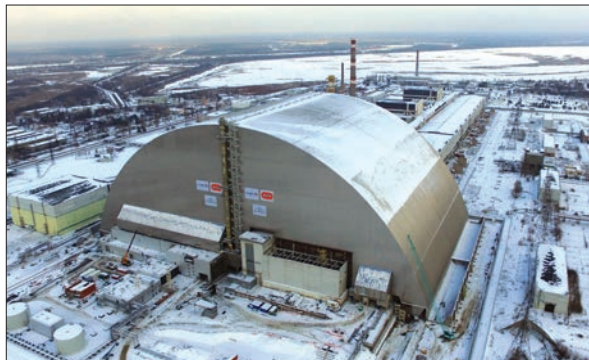
Арка — основна споруда нового безпечного конфайнменту

Слід врахувати, що після демонтажу нестабільних будівельних конструкцій об'єкта «Укриття», який необхідно починати відразу ж після введення в експлуатацію НБК, єдиним бар'єром, що перешкоджає поширенню радіоактивних речовин у навколишнє середовище, буде новий безпечний конфайнмент. Тому розроблення технології вилучення і контейнеризації паливовмісних матеріалів з метою створення додаткового бар'єра для ядерно безпечних матеріалів, які лежать фактично