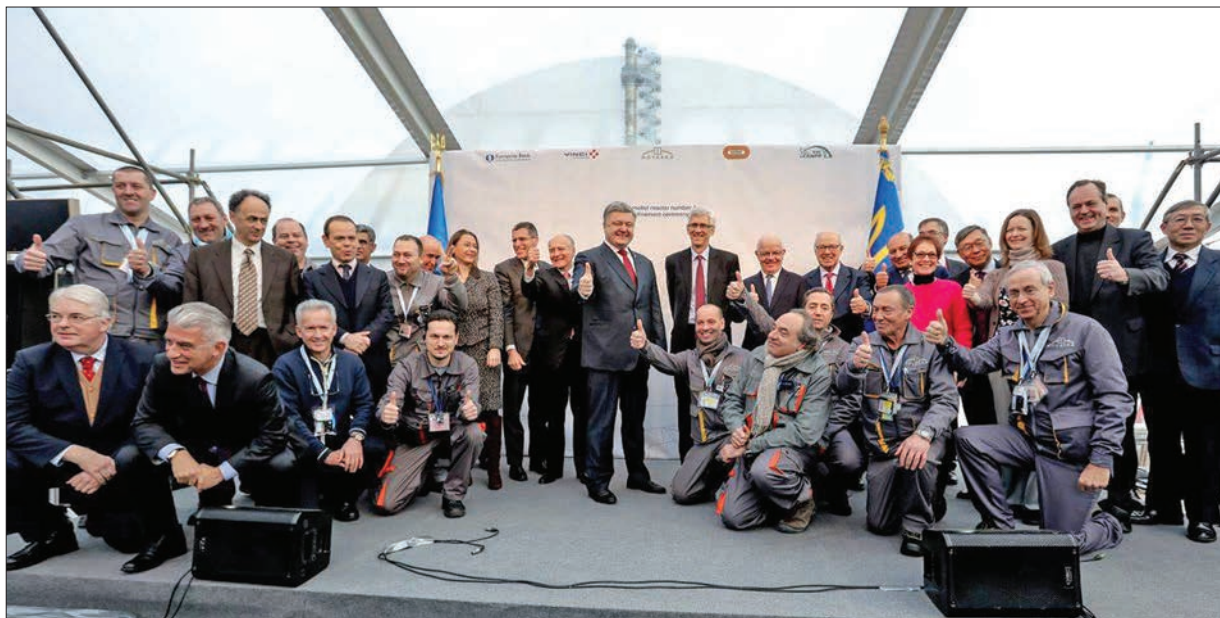
Урочиста церемонія з нагоди встановлення у проектне положення нового безпечного конфайнменту за участю Президента України Петра Порошенка. Чорнобиль, 29 листопада 2016 р.

Отже, одним із найважливіших завдань є розроблення технологічних рішень щодо вилучення паливовмісних матеріалів з використанням систем НБК та обґрунтування безпеки у процесі їх реалізації. Така попередня робота була виконана фахівцями ІПБ АЕС НАН України, і результатом її стали рекомендації щодо обов'язкового вилучення з об'єкта деяких небезпечних скупчень паливовмісних матеріалів [9].