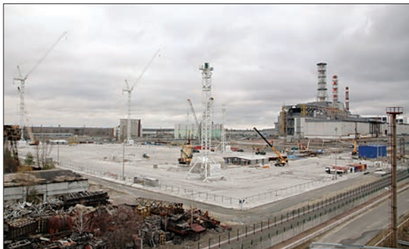
Будівельний майданчик нового безпечного конфайнменту