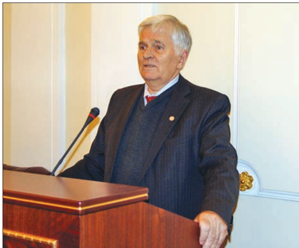
Виступ академіка НАН України Петра Петровича Толочка

ється співіснування пізніх середньопалеолітичних і ранніх верхньопалеолітичних комплексів, тоді як на Північному Кавказі представлений тільки середній палеоліт раннього етапу, а на Середньому Дону й у басейнах Дністра та Пруту існували тільки верхньопалеолітичні комплекси, але впродовж усього перехідного періоду.