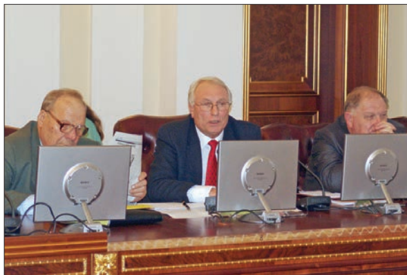
Виступ академіка НАН України Сергія Васильовича Комісаренка

У світовій науці генетична морфологія зараз розвивається бурхливими темпами. Як колись