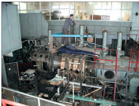
Квазістаціонарний плазмовий прискорювач КСПП X-50 (ННЦ ХФТІ)

У ННЦ ХФТІ зосереджено основну експериментальну базу термоядерних установок, до досліджень з термоядерної проблематики залучено понад 250 науковців та інженерно-технічних працівників з різних інститутів Національного наукового центру, тоді як потужна теоретична школа з фізики термоядерної плазми сконцентрована переважно в Інституті теоретичної фізики ім. М.М. Боголюбова НАН України, Інституті ядерних досліджень