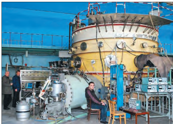
Стеларатор-торсатрон «Ураган-3М» (ННЦ ХФТІ)

кових установках: ННЦ ХФТІ, Інституті ядерних досліджень НАН України, Харківському національному університеті ім. В.Н. Каразіна, Національному університеті «Львівська політехніка», Національному технічному університеті «Харківський політехнічний інститут», Інституті теоретичної фізики ім. М.М. Боголюбова НАН України, Київському національному університеті імені Тараса Шевченка.