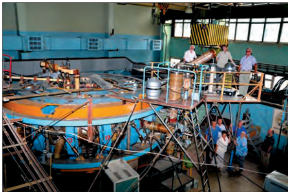
Стеларатор «Ураган-2М» (ННЦ ХФТІ)