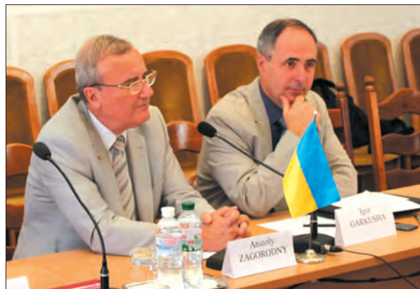
Засідання координаційного комітету ЄВРАТОМ—Україна зі співпраці в галузі термоядерних досліджень

У 2017 р. за поданням НАН України на базі ННЦ ХФТІ створено Український дослідницький центр (Ukrainian Research Unit), що здійснює координацію робіт у 7 українських нау-