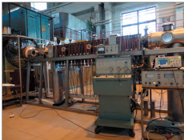
Плазмовий прискорювач нового покоління КСПП-М (ННЦ ХФТІ)

НАН України, Інституті фізики плазми ННЦ ХФТІ, Харківському національному університеті ім. В.Н. Каразіна.