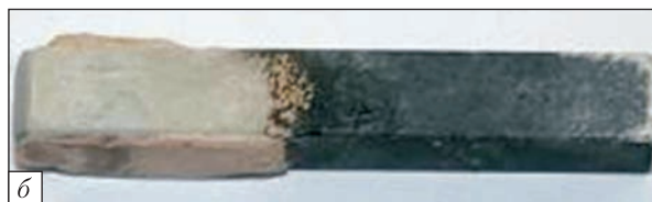
Рис. 2. Результати випробувань перспективних керамічних матеріалів для деталей гарячої частини турбогвинтових двигунів, розроблених в Інституті проблем матеріалознавства ім. І.М. Францевича НАН України: а – зразок у потоці газів пальника; б – стан зразка після 6000 циклів

технологічному зразку. Тривала міцність цього типу з'єднання становить не менш як 80% міцності основного матеріалу. Розроблено також технологію виготовлення зварних біметалевих дисків турбіни.