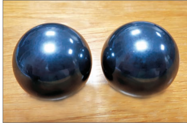
Рис. 3. Виготовлені в Інституті надтвердих матеріалів ім. В.М. Бакуля НАН України дослідні зразки керамічних (з матеріалу В4С) кульок великого розміру (діаметр 42 мм) для підшипників кочення

У 2016 р. фахівці ДП «Івченко-Прогрес» та Інституту надтвердих матеріалів ім. В.М. Бакуля НАН України узгодили основні напрями співпраці зі створення керамічних матеріалів для тіл кочення підшипників і розробили технічне завдання. У грудні 2017 р. співробітники Інституту поінформували фахівців ДП