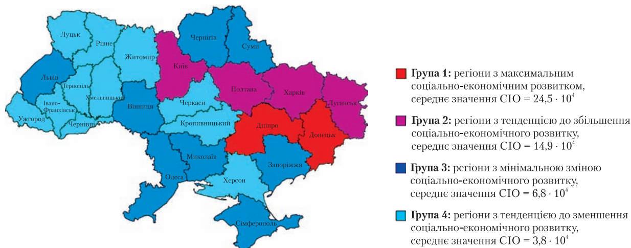
Рис. 3. Результати ранжування адміністративних областей України за сумарною інтенсивністю нічного освітлення

Отже, порівняльний супутниковий аналіз нічної освітленості адміністративних областей України в 1992 і 2012 р. показав, що соціально-економічна ситуація в більшості адміністративних областей за цей період погіршилася (рис. 2). Загальна кількість населення в 25 адміністративних областях станом на 2012 р. зменшилася порівняно з 1992 р. Проте, за даними Державної служби статистики України, в період 1992–2012 рр. у цих областях спостерігалось зростання валового регіонального продукту. Збільшення валового регіонального продукту на фоні зменшення людського капіталу можливе лише на основі надмірної експлуатації природного ресурсу без застосування повного циклу обробки сировини. Такий варіант економічного розвитку називають сировинним.