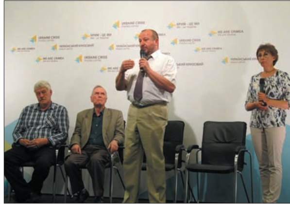
Брифінг науковців НАН України «Українські вчені для АТО: унікальні розробки, які можуть врятувати життя». Український кризовий медіа-центр. 2 червня 2015 р.

Отже, в Україні популяризація досягнень науковців Академії має на меті, по-перше, пояснити суспільству важливість науки для інноваційного розвитку людства загалом, по-друге, показати користь від діяльності науковців Академії зокрема, по-третє, розтлумачити справжні причини і джерела проблем, з якими стикається наукова сфера в Україні, і по-четверте, оперативно реагувати на маніпуляції та недостовірну інформацію, яка поширюється в ЗМІ і стосується Академії. Причому під сло-