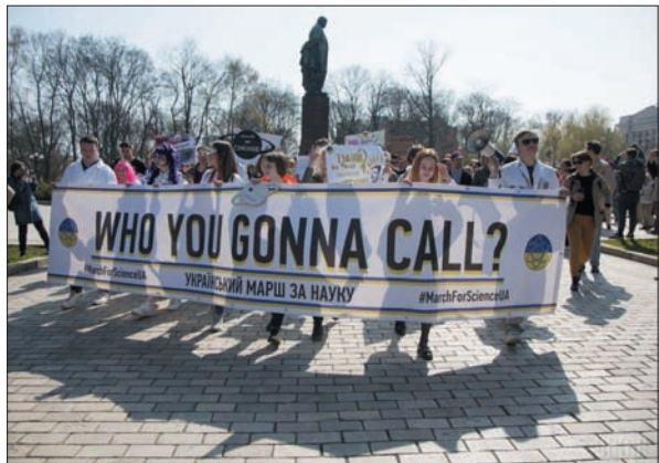
Український марш за науку. 14 квітня 2018 р.

вом «оперативно» мається на увазі не через кілька днів чи тижнів, а відразу, протягом лічених годин після її появи.