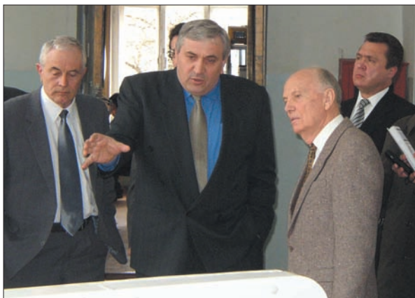
Візит президента НАН України до Радіоастрономічного інституту (зліва направо): академік Л.М. Литвиненко, член-кореспондент Д.М. Ваврів, академік Б.Є. Патон, академік В.П. Семиноженко. 2002 р.

Отримані Леонідом Миколайовичем першорядні наукові результати здобули високу оцінку світової фахової спільноти. Він став основоположником нового наукового напрямку — теорії дифракції і поширення електромагнітних хвиль у композитних та багат шарових періодичних системах; запропонував метод «последовних уточнень» для розв'язання операторних рівнянь другого роду, до яких зводяться задачі радіофізики та електроніки; розробив концепцію використання оператора відбиття напівнескінченних площин у теорії дифракції хвиль на багат шарових періодичних структурах.