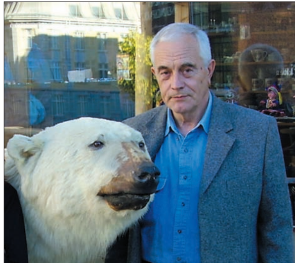
Під час візиту до Арктичного університету Норвегії у Тромсьо. 2005 р.

джен» — премії імені С.Я. Брауде НАН України (2008).