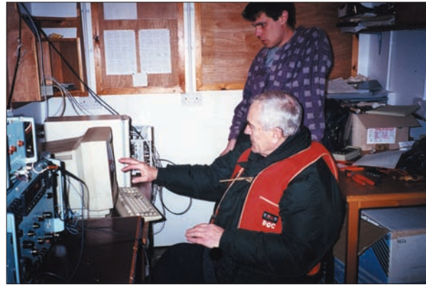
Л.М. Литвиненко зі співробітником О.В. Будановим на антарктичній станції «Академік Вернадський». 2001 р.

За розроблення радіофізичних основ і створення радіоелектронних систем Л.М. Литвиненка було удостоєно Державної премії УРСР в галузі науки і техніки (1987), а за цикл робіт «Нові напрями радіоастрономічних досліджень» — премії імені С.Я. Брауде НАН України (2008).