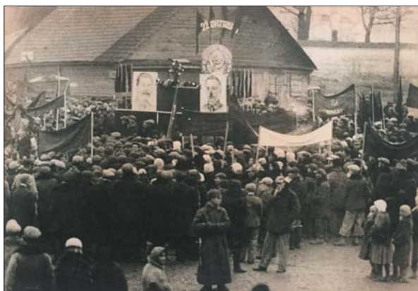
Агітаційний мітинг на Волині перед виборами 22 жовтня 1939 р. Польща, осінь 1939 р.

відмови від війни як інструмента досягнення будь-яких цілей?