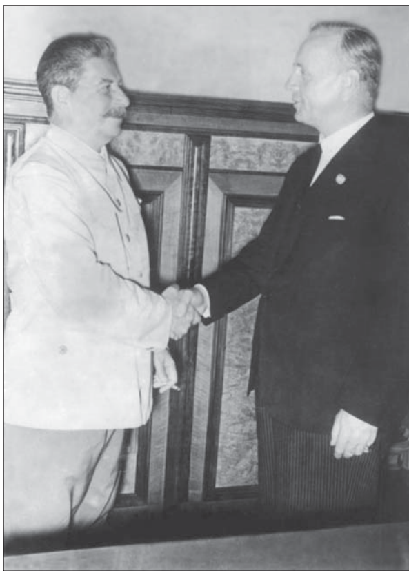
Йосип Сталін і Йоахім фон Ріббентроп тиснуть один одному руки після підписання договору. Москва, Кремль, 23 серпня 1939 р.

дефіцит політичної волі щодо їх дотримання. Ліга Націй як перша міжнародна організація, покликана регулювати міжнародне життя і нейтралізувати конфліктогенні чинники, насправді не стала дійовим інструментом, завдяки якому було б можливо зупинити сповзання світу до воєнної прірви. Обструкція загальнообов'язкових рішень Ліги Націй, принципів мирного співіснування, невтручання у справи інших держав, недоторканності і непорушності їхніх кордонів і територіальної цілісності спричинила вихід з цієї організації у різний час Німеччини (1933 р.), Італії (1937 р.), СРСР (1940 р.). А США взагалі не були членом Ліги Націй, а отже, не могли впливати на вирішення багатьох соціально-економічних проблем або відіграти роль регулятора у системі противаг, принаймні у Європі.