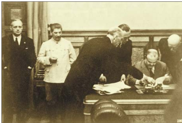
В'ячеслав Молотов підписує Договір про ненапад між Німеччиною та Радянським Союзом і таємний протокол до нього, відомий як «пакт Молотова–Ріббентропа»; стоять (зліва направо): Йоахім фон Ріббентроп, Йосип Сталін, Фрідріх Вільгельм Гаус, Густав Хільгер, Фрідріх фон дер Шуленбург. Москва, 23 серпня 1939 р.