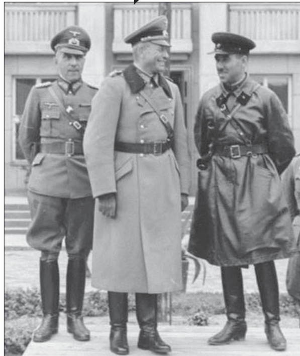
Спільний парад Вермахту та Червоної армії в Бересті по завершенню вторгнення до Польщі. Стоять у центрі і крупним планом генерал-майор Гейнц Гудеріан та комбриг Семен Кривошеїн. 22 вересня 1939 р.

сильнішими. Швидше, навпаки: ті, країни, що зазнали поразок, але, враховуючи їхні уроки, змогли вибудувати свою політичну і економічну стратегію по-іншому, або ті держави, що не вдаються до систематичного застосування насилля та збройної сили, в сучасному світі зрештою посідають провідні позиції. Що може бути переконливішим аргументом на користь