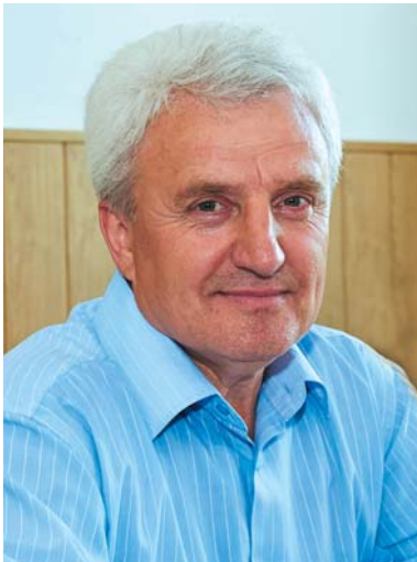
ЛИСЕНКО Олександр Євгенович — доктор історичних наук, завідувач відділу історії України періоду Другої світової війни Інституту історії України НАН України