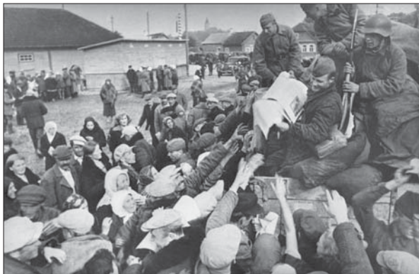
Жителям Вільнюської області роздають радянську пресу. Вересень 1939 р.