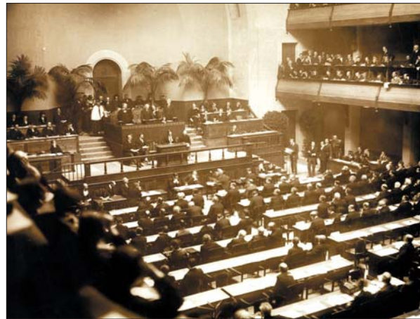
Перше засідання Асамблеї Ліги Націй. Женева, 15 листопада 1920 р.

ступним для молодих «хижаків», що прагнули перерозподілити це усталене поле. Складність цього завдання зумовила зазіхання на території і ресурси суверенних держав.