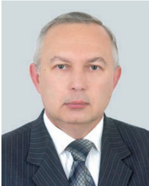
КУШНІР Роман Михайлович — академік НАН України, директор Інституту прикладних проблем механіки і математики ім. Я.С. Підстригача НАН України, голова НТШ в Україні