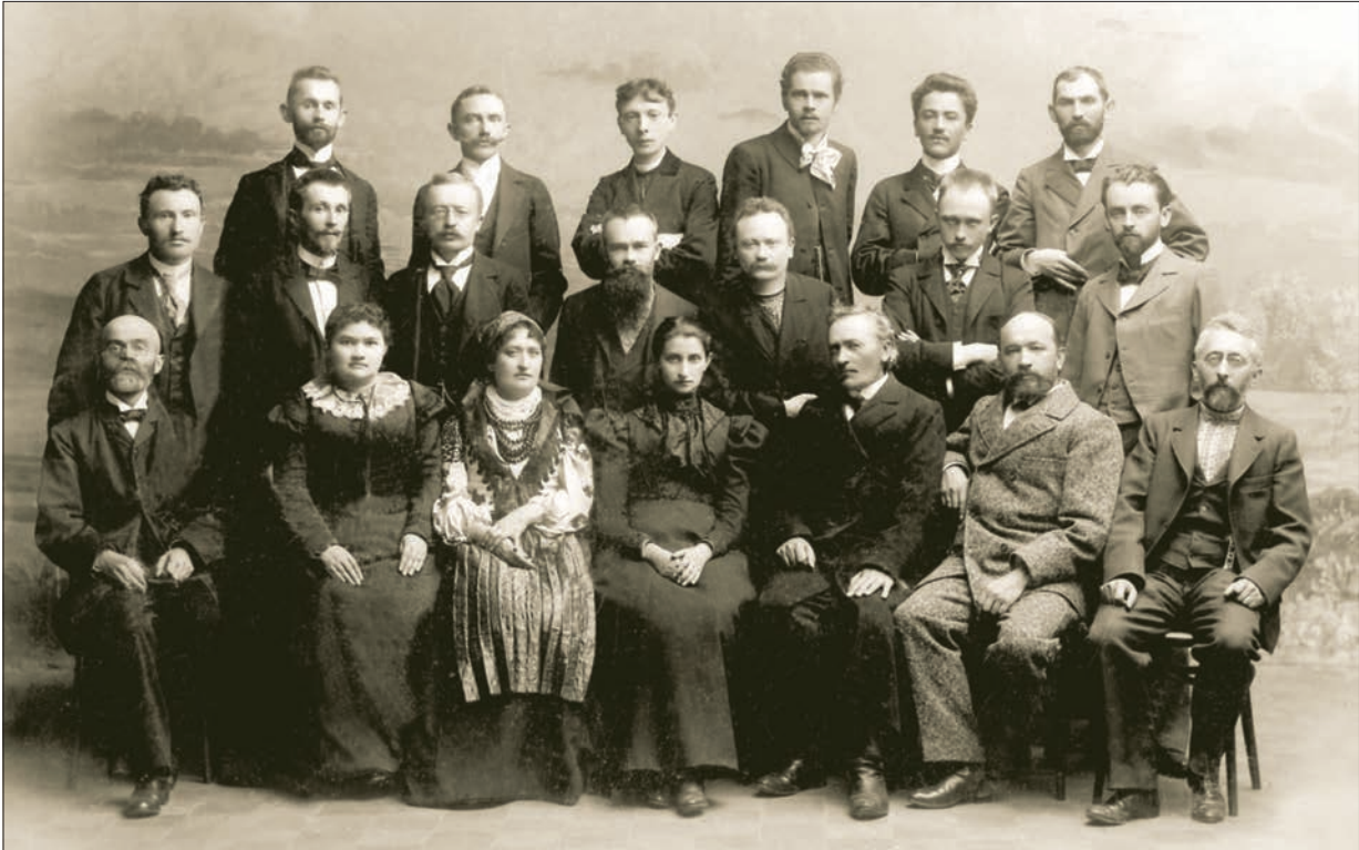
Діячі НТШ на урочистостях з нагоди відкриття пам'ятника Іванові Котляревському в Полтаві, 1903 р.

кадрів і матеріального забезпечення. У вересні 1914 — червні 1915 р., через захоплення Львова російськими військами, Віділ Товариства перебував у Відні, засідання комісій і секцій не скликалися. Тоді ж було закрито книгарню й бібліотеку, конфісковано друкарню, Академічний дім перетворено на казарми. НТШ зазнало величезних фінансових збитків, дуже постраждало обладнання друкарні, було втрачено низку підготовлених до друку видань, частину архіву. У 1923 р. польська влада позбавила Товариство права друкувати шкільні підручники для українських шкіл, що ще відчутніше погіршило його матеріальний стан, оскільки, як уже зазначалося, велику частку фінансування НТШ становив дохід від діяльності друкарні та книгарні, а також від чиншових виплат з нерухомості.