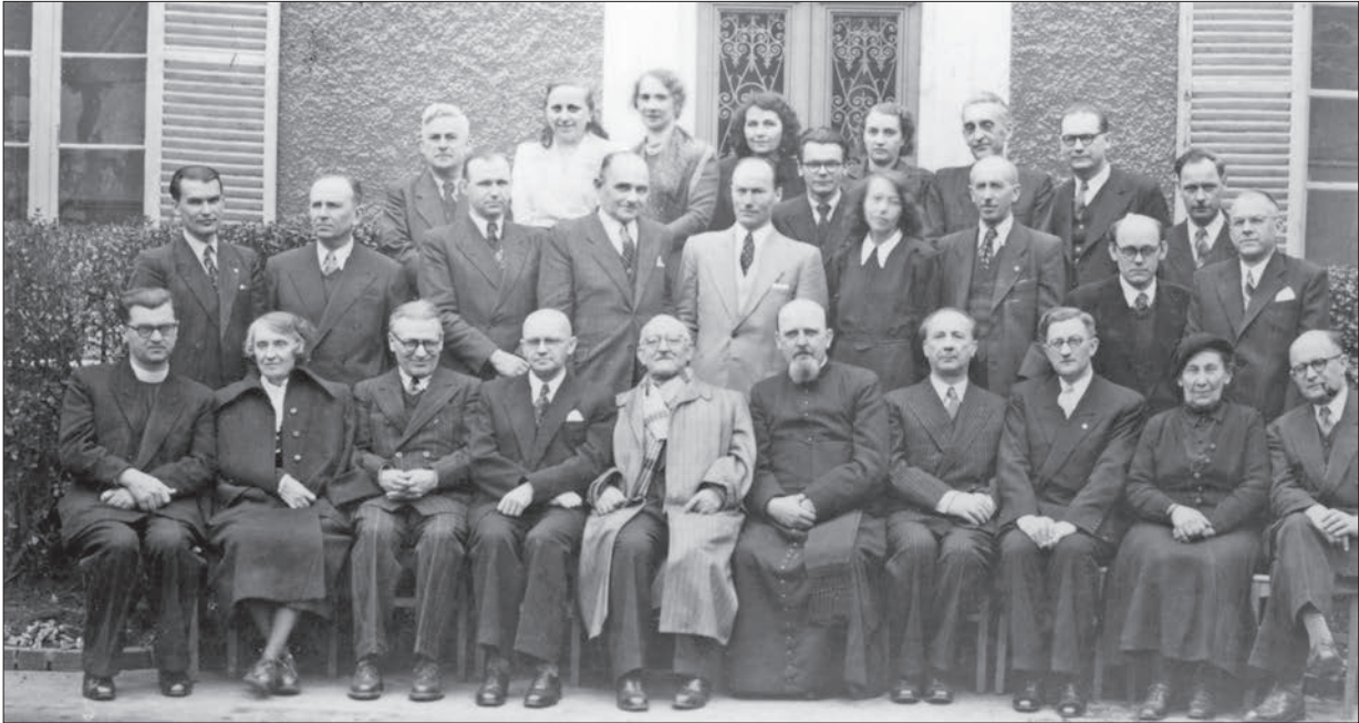
Загальні збори НТШ в Європі. Сарсель, Франція, 1952 р.

«Життя Тараса Шевченка» П. Зайцева (1955) та «Етнічні групи Південно-Західної України (Галичини) на 1.01.1939» (1983) В. Кубійовича. Товариство також приділяло увагу просвітницькій та науково-організаційній роботі. Проводили літні українознавчі курси для студентів, виступали з доповідями в осередках української міграції у Франції, Бельгії, Англії, Німеччині, організували конференції, виставки книжок [16].