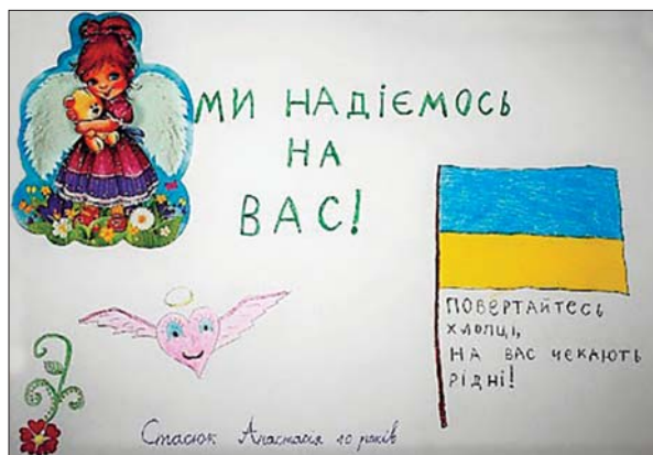
Дитячий малюнок, переданий солдатам у зону АТО/ООС

по фронтовиках місця в цивільних урядах, фабриках? А може, має бути всюди — відповідно до здібностей, доброї волі і охоти? [...] Де мало бути те наше місце, що нам належить і відповідає, ми ані не доказали цього, ані не вияснили, яка праця найбільше відповідає жінці в часі війни — відповідно до її знання, заняття, літ і фізичних сил. Цю справу вияснить і розв'яже з часом само життя» [4].