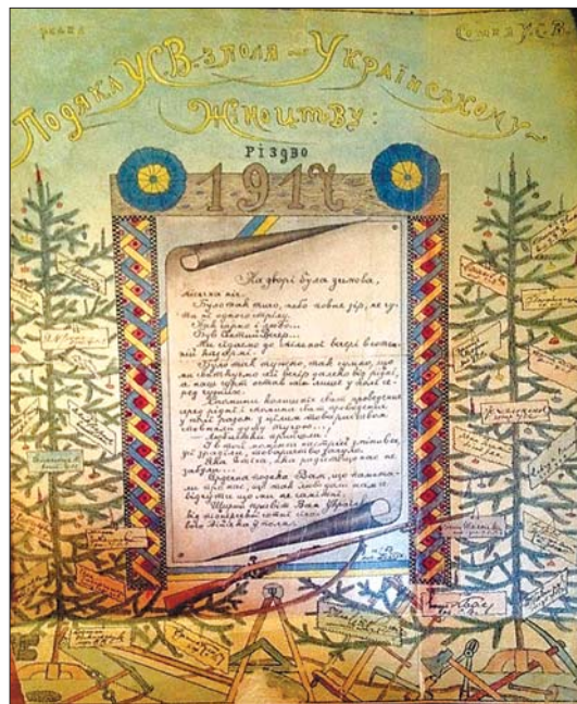
Лист-подяка Українському Жіноцтву [6].

Поза цим у сучасній українській історіографії і публічному просторі майже не обговорюється, як військова реальність впливає на психіку та емоції самих жінок. Залишається відкритим питання, як жінки справлялися та справляються з втратою близьких людей (чоловіків чи дітей), насильством, перебуванням під обстрілами в тилу чи на передовій, співжиттям з ворогами (в роки тотальних воєн жінки часто були змушені мешкати поряд із солдатами ворожих армій, що квартирували в їхніх оселях).