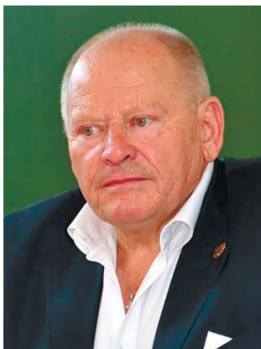
ЖУЛИНСЬКИЙ Микола Григорович — академік НАН України, директор Інституту літератури ім. Т.Г. Шевченка НАН України