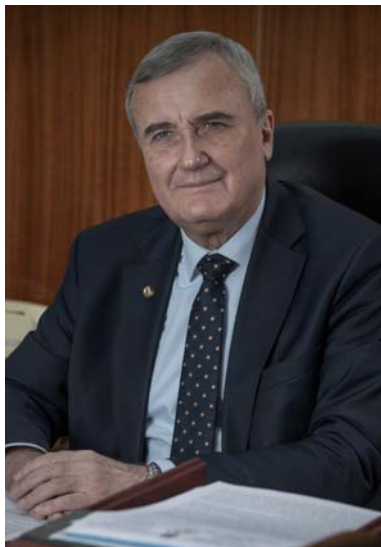
ЗАГОРОДНІЙ Анатолій Глібович — академік НАН України, президент Національної академії наук України