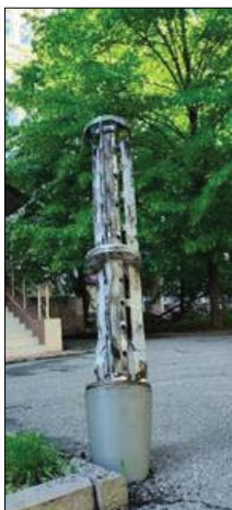
Рис. 1. Окремі приклади руйнувань інфраструктури установ НАН України

лів столиці. Лише в травні цього року по Києву було завдано більш як 250 ударів ракетами та БПЛА. Гадаю, що коментарі тут зайві.