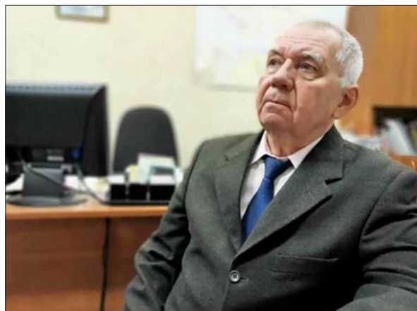
Академік Володимир Анатолійович Широков

Слід зазначити, що при побудові наукових теорій яскраво проявилася така риса Володимира Анатолійовича, як дар сміливого наукового узагальнення, вміння бачити в конкретних мовних об'єктах прояви фундаментальних інформаційних властивостей світу. На цьому шляху він відкрив абсолютно новий феноменологічний принцип — лексикографічний ефект в інформаційних системах, який демонструє механізми породження зі світового континууму певних дискретних спектрів, які утво-