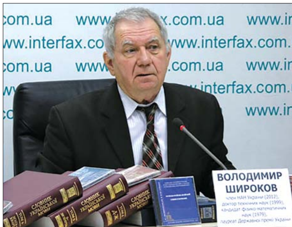
Академік Володимир Широков на пресконференції в агентстві «Інтерфакс-Україна». 2016 р.

О. Костишиним, М. Кригіним та ін.; 2005); «Елементи лексикографії» (2005); «Квантова лінгвістика» (2007); «Ноосферні виміри інформації і знання» (2008); «До питання про системну концептографію Святого Письма» (у співавторстві з Л. Шевченко, 2010); «Лінгвістичні та технологічні основи тлумачної лексикографії» (у співавторстві з В. Білоноженко, О. Бугаковим та ін.; 2010), «Гіперланцюги в лексикографічній репрезентації лексико-семантичних відношень» (2010); «Комп'ютерна лексикографія» (2011); «System Semantics of Explanatory Dictionaries» (2012); «Лінгвісти-