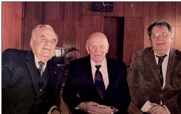
Академік В.А. Широков із президентом НАН України академіком Б.Є. Патонем та професором Г.В. Каша-кашвілі. 2008 р.