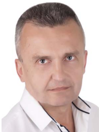
КОТИГОРЕНКО Віктор Олексійович — доктор політичних наук, професор, завідувач відділу етнополітології Інституту політичних і етнопонаціональних досліджень ім. І.Ф. Кураса НАН України