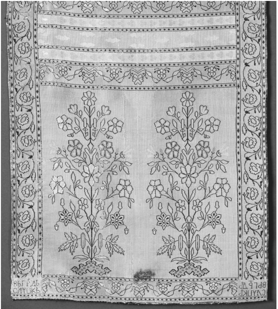
Мал. 4. Слуккі пояс тыпу “сухарык” з выявай лёну. Фрагмент. 1780-я – 1807 гг. Нацыянальны мастацкі музей Рэспублікі Беларусь, Мінск

Персідскія паясы з выявамі арнаментальна-кветкавых медальёнаў на канцах паслужылі прыкладам для стварэння на слуцкай фабрыцы дэкаратыўнай кампазіцыі “вянкова-медальённага” тыпу. Яна ўтворана двухразовым паўтарэннем сіметрычнага адлюстравання выцягнутага па вертыкалі вянка, сплеченага з дробных, на доўгіх ножках, кветак кшталту гваздзічкі, валошак ці рамонак. Злева і справа ад вяноў адлюстраваны