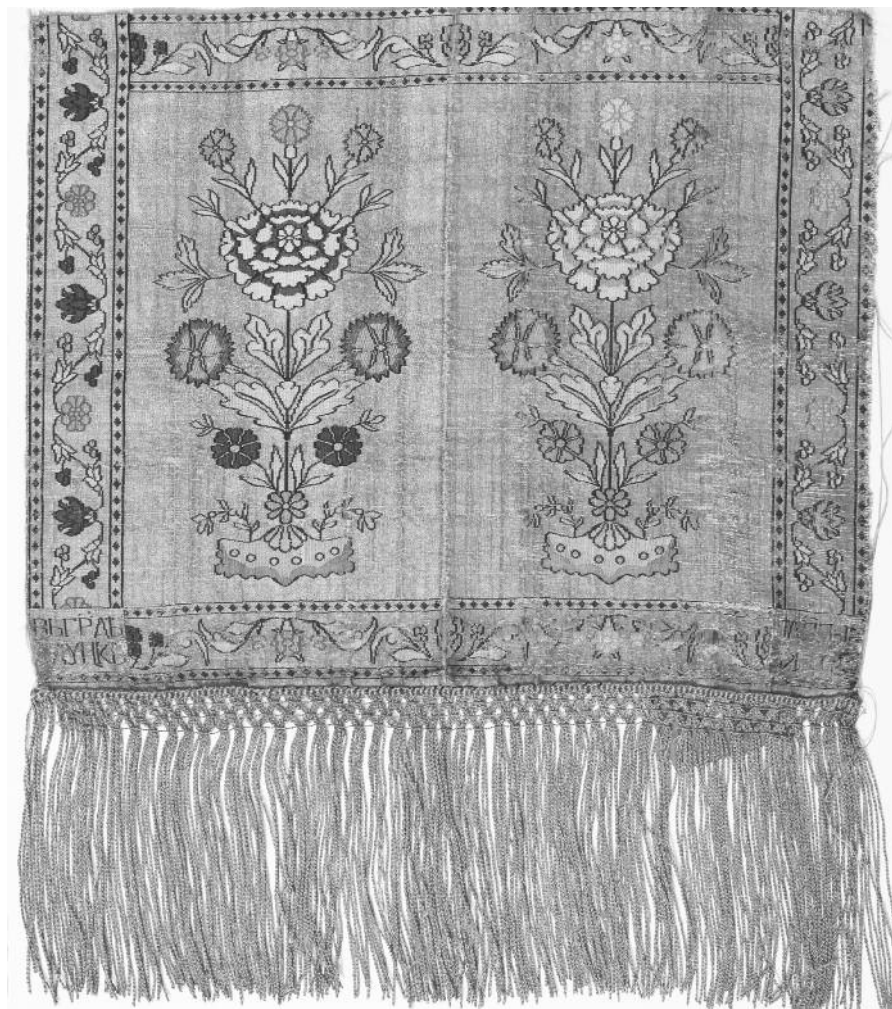
Мал. 3. Слуцкі пояс тыпу “карумфiль” з выявай валашкі. Фрагмент. Слуцк. 1780-я – 1807 гг. Нацыянальны гістарычны музей Рэспублікі Беларусь, Мiнск

На прыканцы XVIII – у першыя дзесяцігоддзі XIX ст. на слускай мануфактуры шырока выкарыстоўваўся яшчэ адзін дастаткова самастойны арнаментальны матыў аздабы канцоў паясоў, які вытанчана сця свайго малонка адалена нагадвае дэкаратыўны тып “сухарык” пры візуальным падабенстве адлюстраванай расліны да квітнеючага лену (мал. 4).