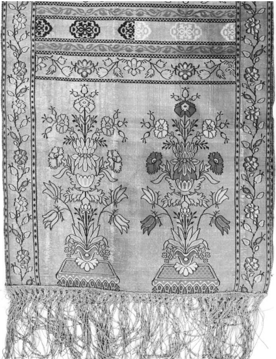
Мал. 7 Служкі паяс “букетавага” тыпу. 1780-я – 1807 гг. Музей ўкраінскага народнага дэкаратыўнага мастацтва, Кіеў