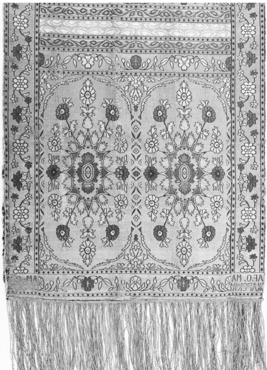
Мал. 5. Слуцкі пояс “вянкова-медальённага” тыпу. Фрагмент. 1780-я – 1807 гг. Нацыянальны мастацкі музей Рэспублікі Беларусь, Мінск