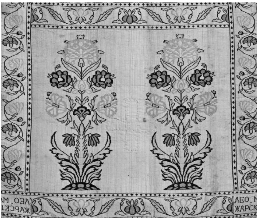
Мал. 1. Слуцкі пояс тыпу “карумфiль”. Фрагмент. 1780-я – 1807 гг. Музей старажытнабеларускай культуры НАН Беларусi, Мiнск

Пад натхненнем ад арнаментациi персiдскiх i кiтайскiх паясоў быў створаны дэкаратыўны тып “сухарык” 25 . Яго найменне таксама ўзникла ад скажонага турэцкага слова, што перакладаецца як “расада”. Кампазицыя матыва ўтвараецца двукратным адлюстраваннем строга сiметрычнай вытанчанага раслiнкі з дастаткова дробнымi кветкамi i вузкiмi зубчастымi лiсцiкамi (мал. 2).