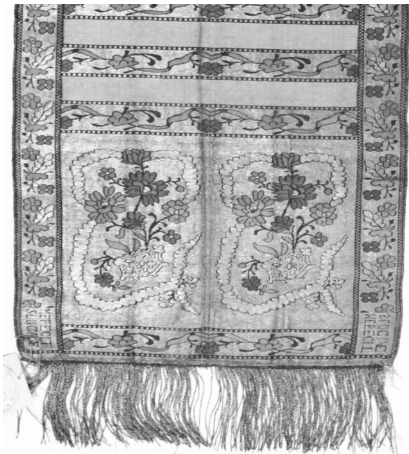
Мал. 6. Слукцi пояс тыпу “кітайскае воблачка”, трэці варыянт дэжору. 1760-я гг. Музей ўкраiнскага народнага дэкаратыўнага мастацтва, Кіеў

У адрозненне ад папярэдне пералічаных тыпаў, якія ў той ці іншай ступені арыентаваліся на ўсходні мастацкі тэкстыль, пры распрацоўцы кампазіцый дэкаратыўнага тыпу “ букет ” у сіметрычны выяўленчы матыў з адлюстраваннем некалькіх, сабраных у пучок, уквечаных раслін, уводзіліся элементы, запазычаныя з еўрапейскіх мастацкіх стыляў, найперш – моцна стылізаваныя выявы кветак кшталту півоняў, лотацяў, лілей, і дэкаратыўных падставак-ваз, у якіх расліны змяшчаюцца (мал. 7).