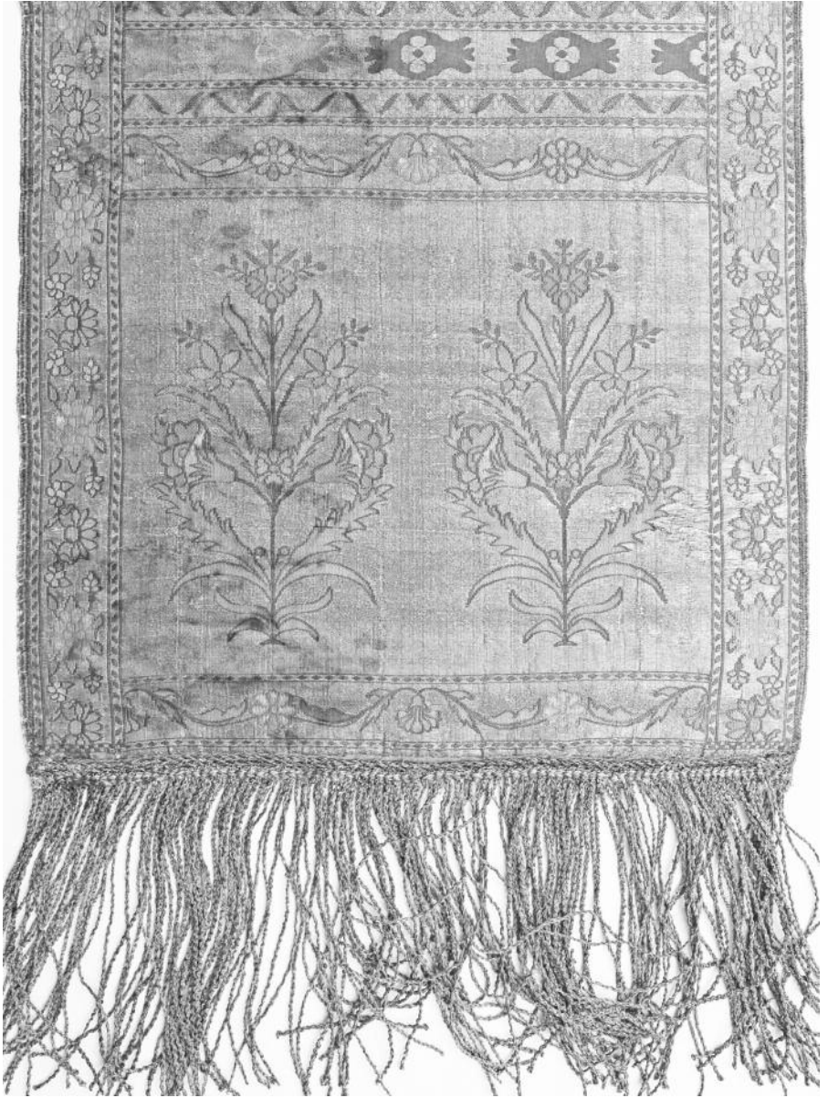
Мал. 2. Слуккі паяс тыпу “сухарык”. 1770-я – 1790-я гг. Мінскі абласны краязнаўчы музей ў г. Маладзечна