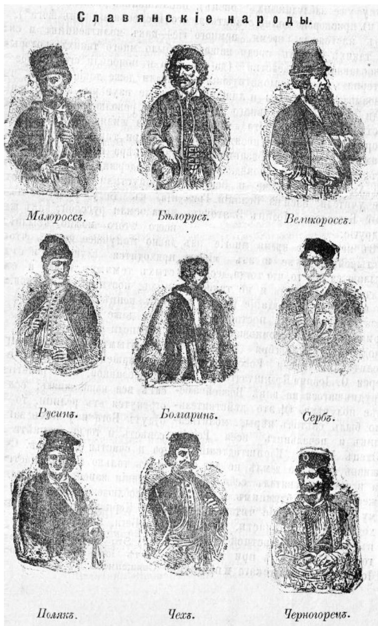
Мал. 2. Слов'янські народи