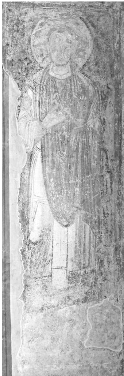
Мал. 2. Образ св. Козми в західній внутрішній галереї Софії Київської

Парним святим Козмі є Даміан, що дозволяє припустити наявність саме образу на протилежному виступі стіни, де фреска ХІ ст. не збереглася і де в ХІХ ст. був зображений св. Філарет. Таке розташування святих у цьому компартименті є єдиним допустимим. Композиційно двоїця св. цілительів Козми та Даміана фланкувала перехід із західної внутрішньої галереї до приділа свв. Йоакима та Анни.