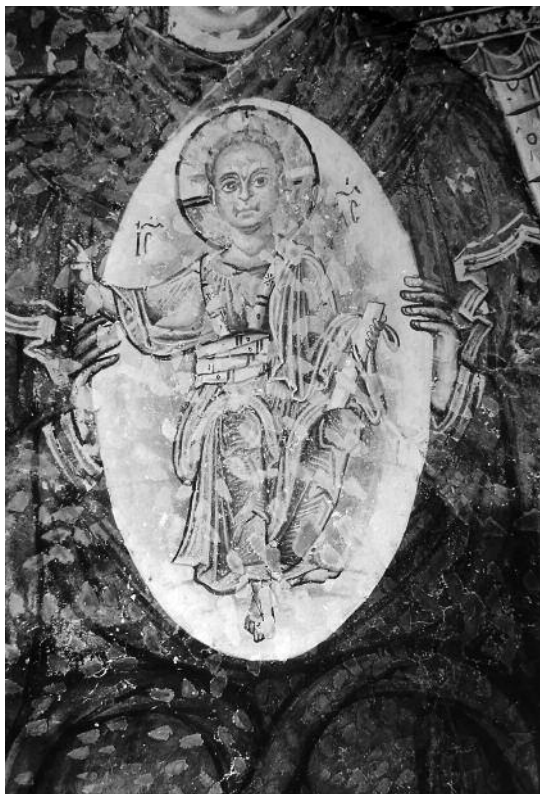
Мал. 3. Фреска “Богородиця Нікопея”. Деталь. Софія Охридська. 1040 р.

тримають щит – символ Христа як Спасителя і Триумфатора (мал. 3). На Русі Нікопеєю називали ікону Божої Матері з Богонемовлям у круглому медальйоні, близьку за іконографією типу ікони Богородиці “Знамення”. На думку В. Шандровської, названий тип, що являє собою сплав зображення Нікопеї і Оранти (Тої, що молиться, тобто Богородиці з молитовно здійсненими руками), зустрічається лише з XI ст. 3 Але вперше поясне зображення Оранти з Немовлям Христом на грудях фігурує на фресці в катакомбах Агнії в Римі (IV–V ст.). Власне ж Оранта є найбільш давнім образом Богоматері, що також з’явився ще в катакомбному мистецтві 4 .