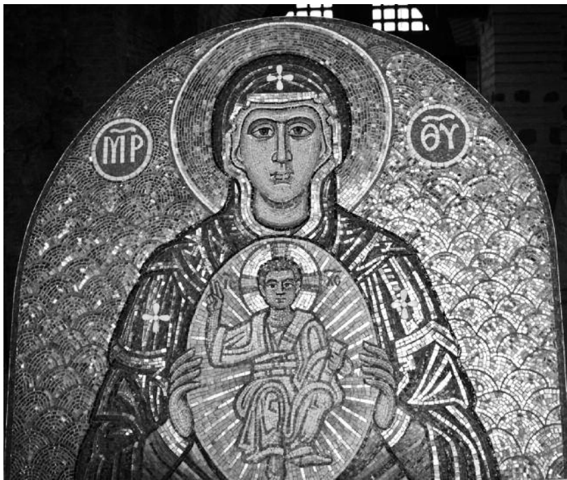
Мал. 1. Мозаїка “Богородиця Нікопея”. Л. Тоцький. 2016 р.

Отже, судячи з усього, над Золотими воротами з боку поля знаходилася ікона Богородиці з Немовлям. Причому аркові заглиблення над воротами (люнети), в які вставлялися ікони, мали бути, за традицією, як з боку поля, так і з боку міста. На жаль, на нинішньому павільйоні-реконструкції є лише одна арка – з боку міста, хоча надбрамних ікон мало бути дві – з напольного і міського фасадів. Це, радше за все, мали бути найбільш війські образи Богородиці з Немовлям – Одігітрія (Провідниця), що відправляла воїнів на брань, і Нікопея (Побідоносна чи Даруюча перемогу, Переможна), що зустрічала їх з перемогою. Логічно думати, що Одігітрія була на напольному фасаді воріт, а Нікопея – на міському. Саме образ Нікопеї ми й запропонували встановити на міському (північному) фасаді Золотих воріт.