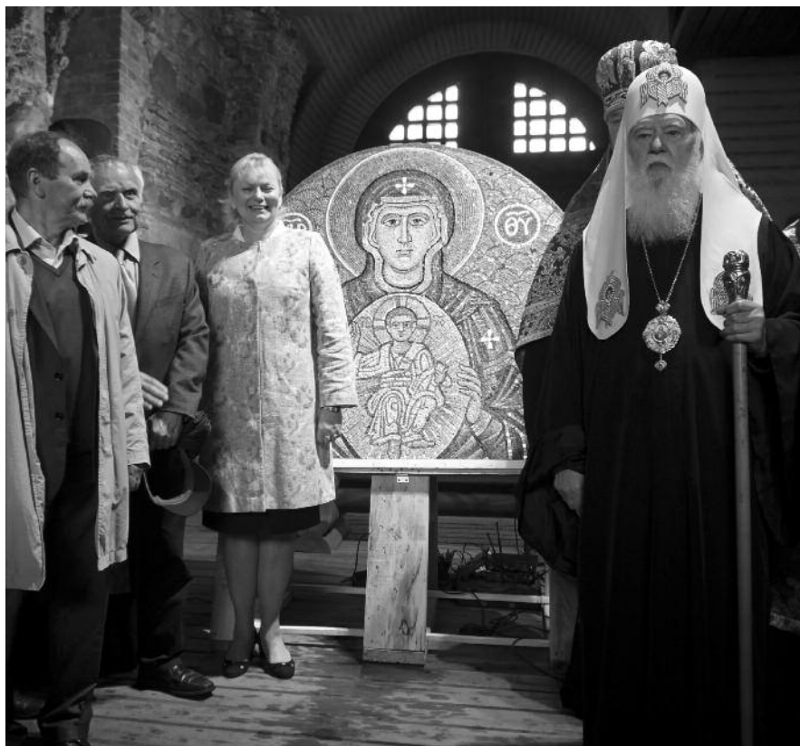
Мал. 5. Святійший Патріарх Київський і всієї Руси-України Філарет та генеральний директор Національного заповідника “Софія Київська” Н. Куковальська біля освяченої мозаїчної ікони “Богородиця Нікопея”. Золоті Ворота. 19 травня 2016 р.

Проект мозаїчного панно (картон) обговорювався та корегувався фахівцями Заповідника та істориками і мистецтвознавцями з інших наукових установ Києва. Останній варіант було обговорено та одногосно прийнято Вченою радою Національного заповідника “Софія Київська” (протокол № 1 від 20.02. 2016 р.). 16 березня 2016 р. проект був обговорений і одногосно схвалений Науково-методичною радою Міністерства культури України.