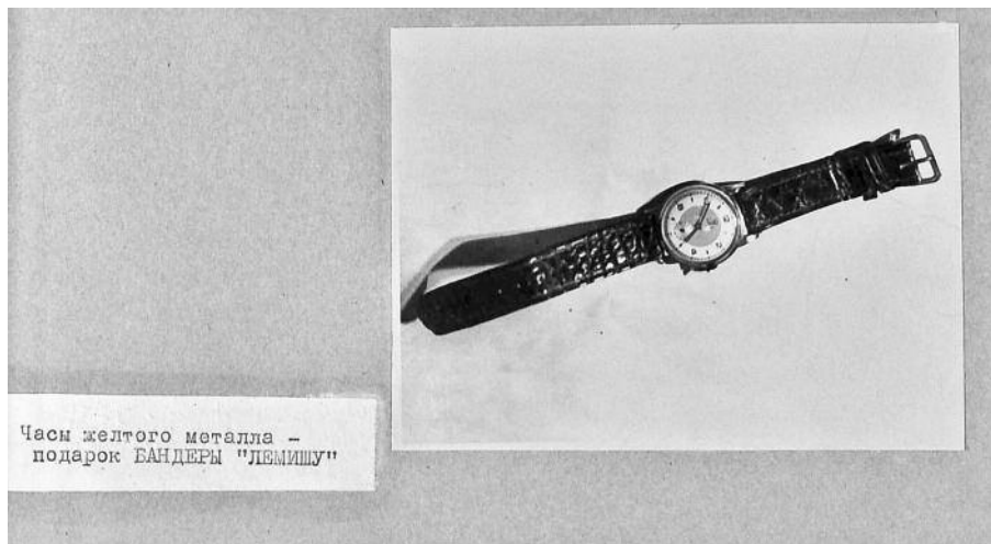
Годинник, вилучений у В. Кука (ГДА СБУ, ф. 65, спр. С-9115, т. 52, арк. 24)