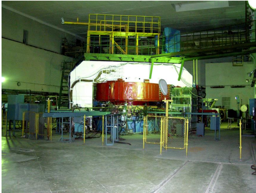
Ізохронний циклотрон У-240.

Слід також відзначити дослідження, проведені на ядерному спектрометрі (академік АН КазРСР, чл.-кор. АН УРСР Г. Д. Латишев, д-р