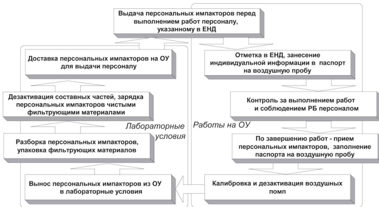
Рис. 2. Детализированная структура экспериментальной части программы с описанием последовательно выполняемых операций