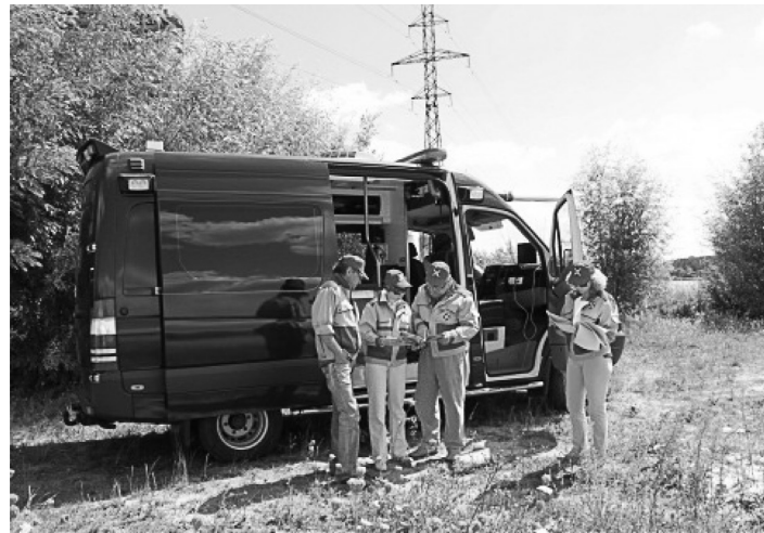
Екіпаж мобільної радіологічної лабораторії RanidSONNI на тренуваннях

У листопаді 2014 року фахівці ДНТЦ ЯРБ взяли участь у плановому загальностанційному протиаварійному тренуванні на майданчику Рівненської АЕС, яке проводилося спільно з Дирекцією НАЕК «Енергоатом»