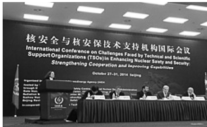
Міжнародна конференція, м. Пекін, 27—30 жовтня 2014 року