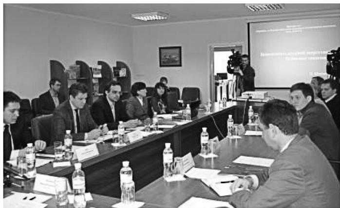
Круглий стіл «Чорнобиль та Фукусіма-Даїчі: вплив на розвиток світової ядерної енергетики», 23 квітня 2014 року, м. Київ