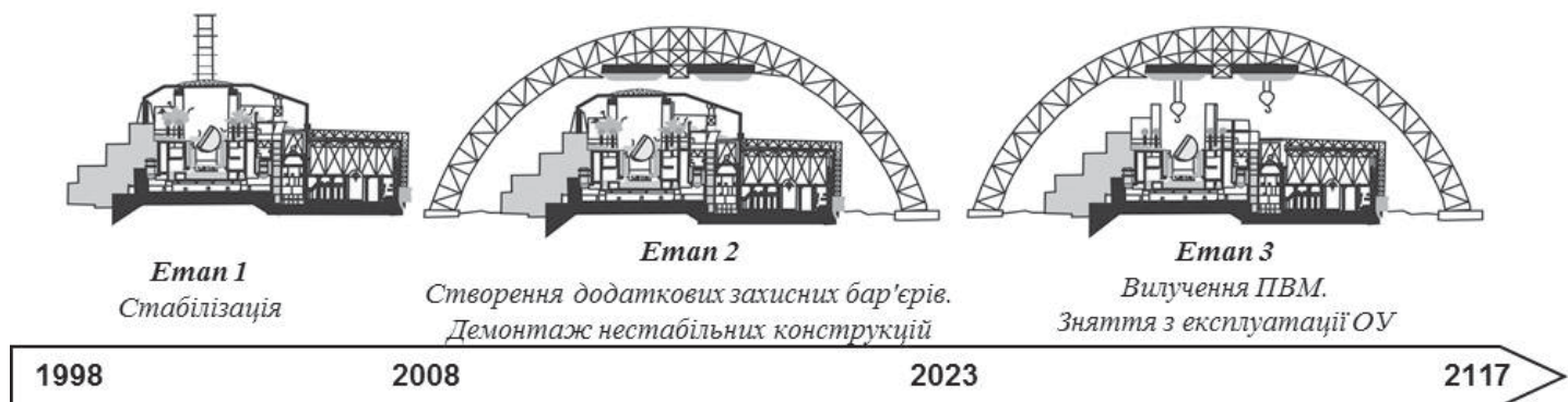
Рис. 2. Перетворення ОУ на ЕБС