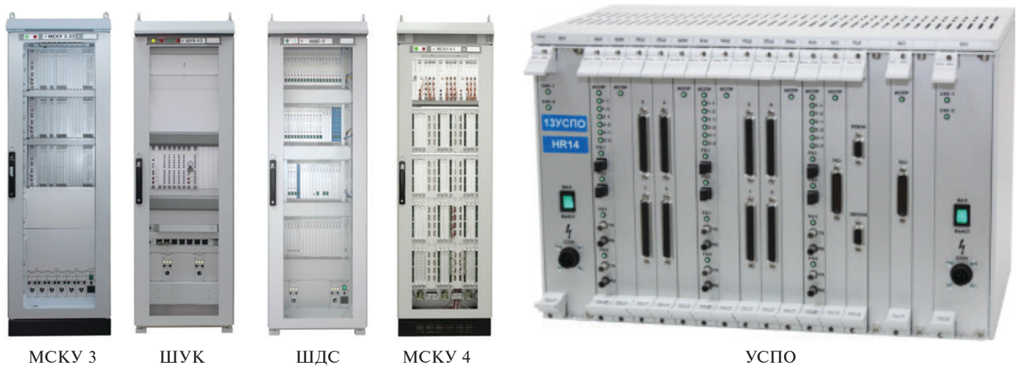
Рис. 2. Внешний вид базовых компонентов ПТК УСБТ и ПТК УСНЭ