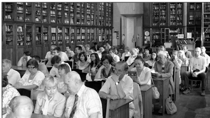
Присутні на презентації науковці, журналісти, зацікавлені особи.