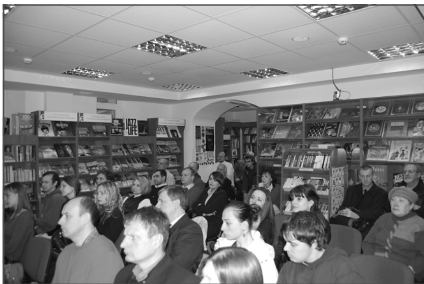
Присутні на презентації науковці, журналісти, зацікавлені особи.

лежності своєї держави, відтворив передумови й окреслив основні етапи військово-організаційної розбудови зазначеного збройного формування. Також автор реконструював однострої, відзнаки та структуру «Карпатської Січі».