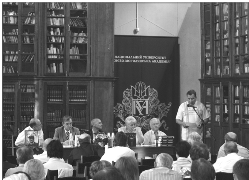
Обговорення книги «Великий терор в Україні. “Куркульська операція” 1937–1938 рр.».