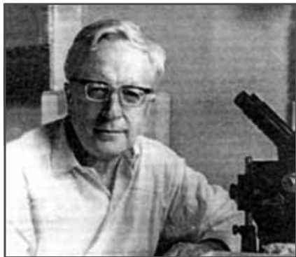
Меркурій Сергійович Гіляров.

Своєю смертю до винесення вироку він врятував сина — Меркурія Сергійовича Гілярова (1912–1985 рр.). С. Гіляров міг би пишатися сином, який став академіком АН СРСР, видатним ентомологом, засновником ґрунтової зоології, автором понад 500 наукових праць, тричі лауреатом Державних (Сталінських) премій, головним редактором «Журнала общей биологии».