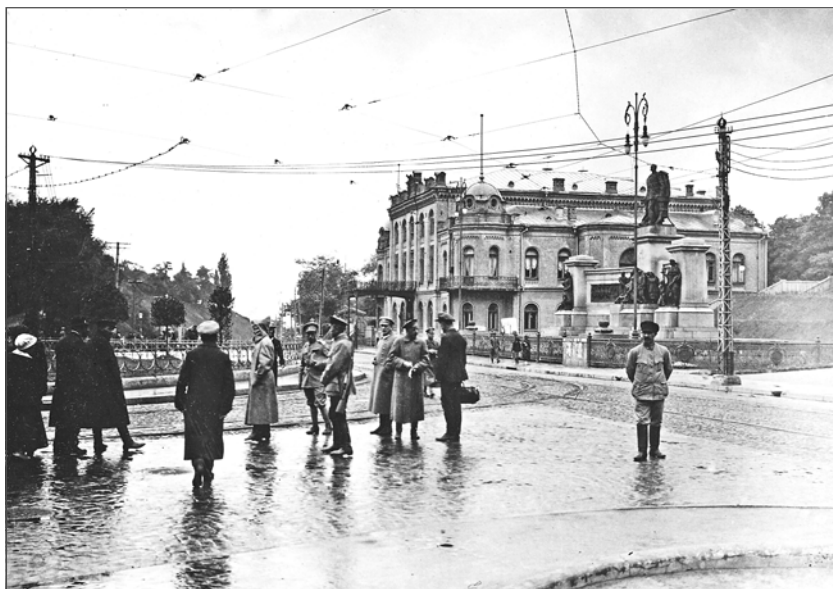
Царська (нині – Європейська) площа в Києві, вид на будинок Купецьких зборів, де розташовувалося керівництво Всеукраїнського союзу георгіївських кавалерів. Осінь 1918 р. Фото з приватної колекції.