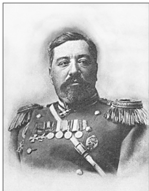
Генерал Георгій Ступін – голова Георгіївської думи Української Держави.

Організація Георгіївської думи покладалася на героя російсько-японської та Першої світової війн, кавалера орденів Святого Георгія 4-го, 3-го ступенів і золотої Георгіївської зброї генерал-лейтенанта Георгія Володимировича Ступіна. По закінченні Першої світової війни він мешкав у Києві та був ініціатором відновлення діяльності Союзу георгіївських кавалерів. Коли у жовтні 1918 р. гетьман П. Скоропадський оголосив мобілізацію офіцерів, генерал Г. Ступін також вирішив сформувати військову частину. Від імені Всеукраїн-