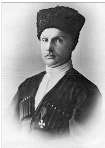
Гетьман Павло Скоропадський з орденом Святого Георгія 4-го ступеня.

Генерал П. Скоропадський, ставши гетьманом, негайно засудив усі декрети більшовицького уряду. Серед іншого, наказом Військової офіції Української Держави № 221 від 16 червня 1918 р. було повернуто