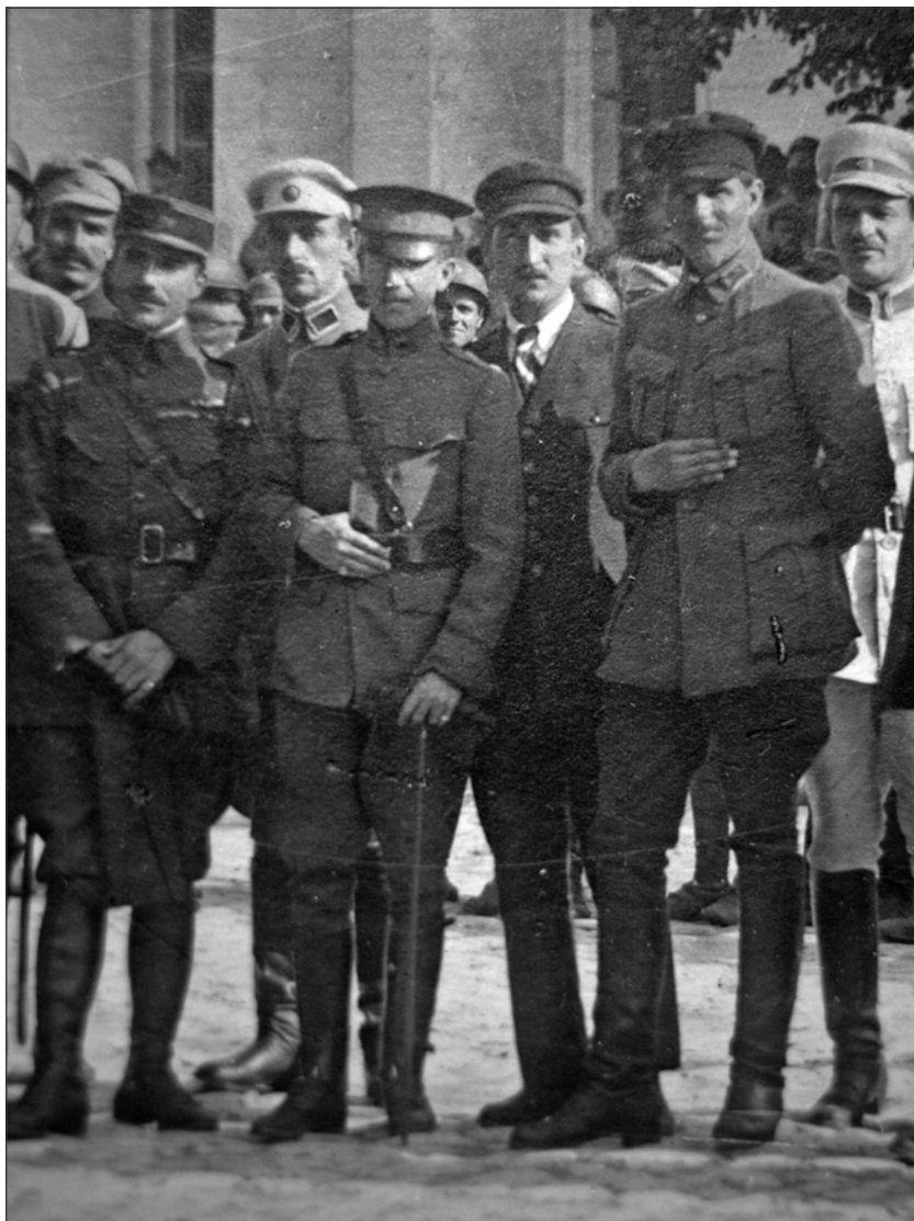
Французький капітан Бомон, невідомий, англійський полковник Фрітч, французький старшина (?), командувач Дієвою армією УНР В. Тютюнник.