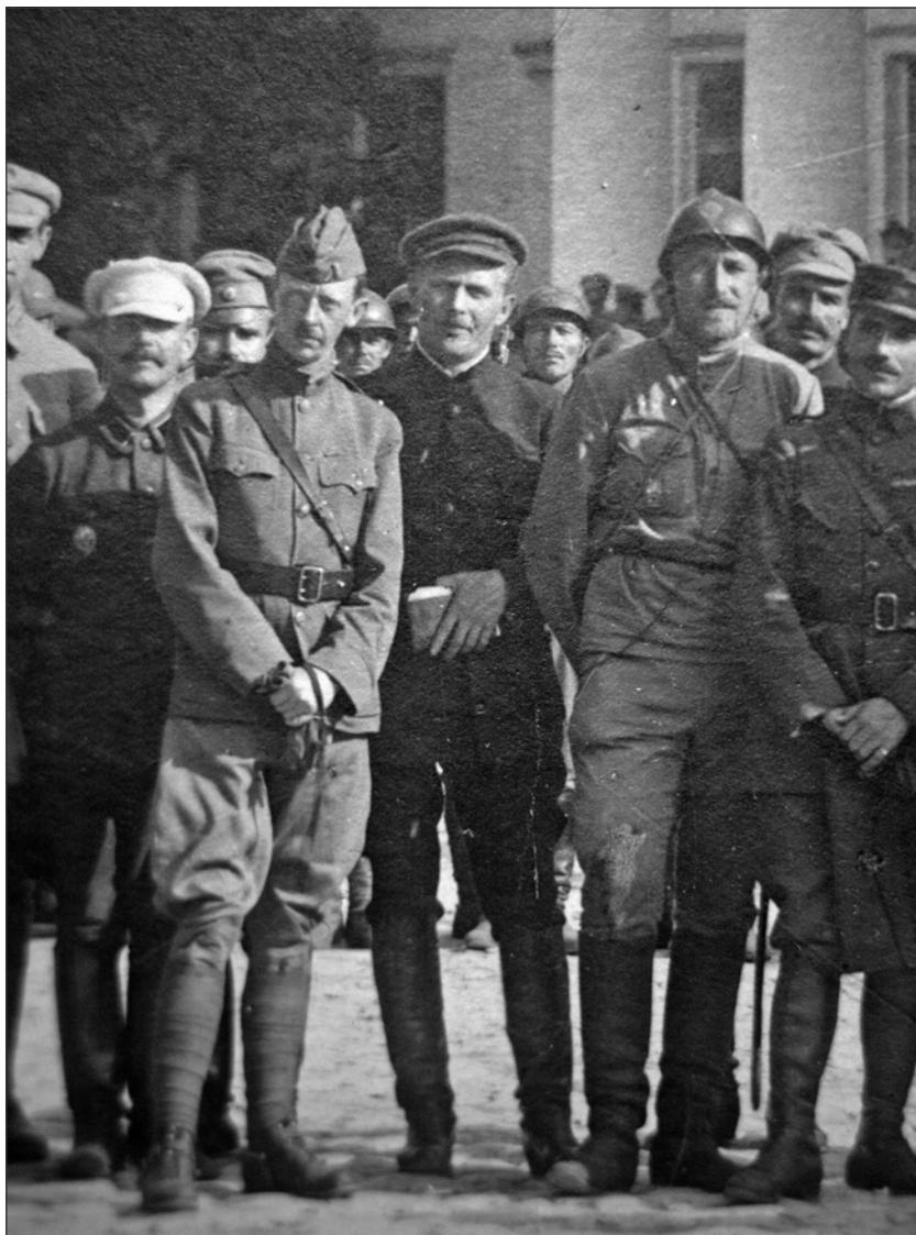
Полковник М. Капустянський, підполковник армії США Лінстрон, невідомий, військовий міністр УНР В. Петрів, французький капітан Бомон (фрагмент фото з Кам'янець-Подільського державного історичного музею-заповідника).