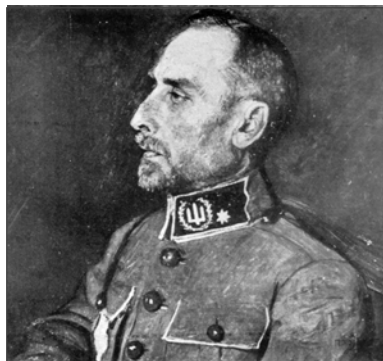
Портрет генерал-поручика Армії УНР Володимира Сінклера, виконаний на початку 1920-х рр. (портрет зі збірника «За Державність»).

Власне, з історії цього повернення і починається спогад-оповідання Євгена Маланюка про Володимира Сінклера. Маланюк згадував, що наприкінці 1918 р., коли проти УНР почала активну війну радянська Росія, перед командуванням армії, яке у той час фактично уособлював Василь Тютюнник (бо решта військових керівників займалися винятково політичною діяльністю), постало кадрове питання. Штаб Дієвої армії УНР потребував досвідчених фахівців. Генерал В. Сінклер у той час мешкав у Києві, особ-