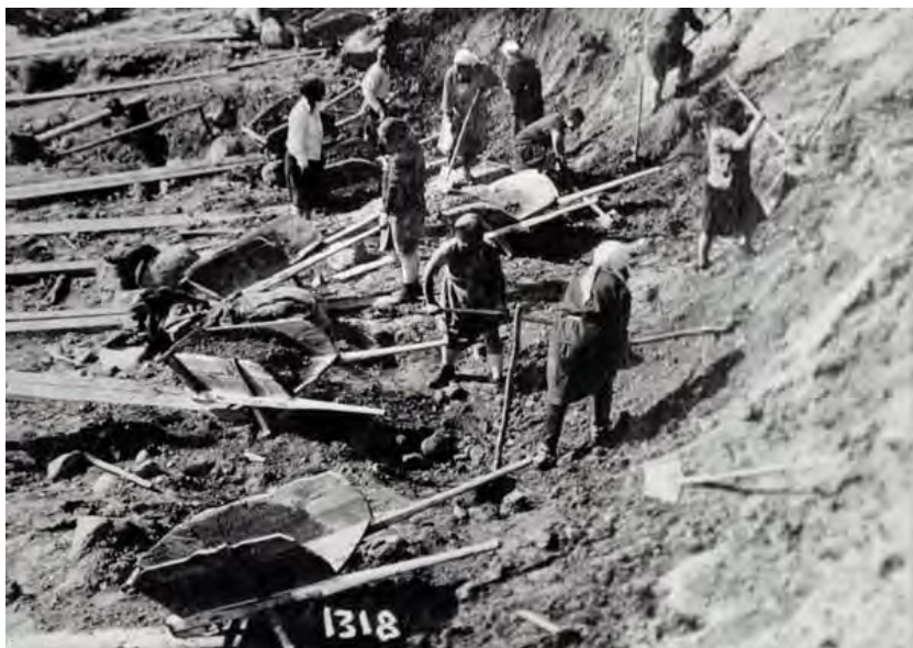
Ув'язнені жінки працюють з лопатами та тачками на земляних роботах під час будівельних робіт Біломорканалу 60