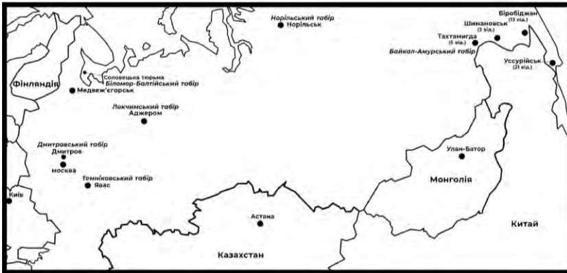
Схема розміщення таборів, де відбували покарання засуджені у 1933 р. за канібалізм.

У таблиці № 2 подана докладна інформація (за наявності) про засуджених за канібалізм: стать засудженої особи, в якому відділенні чи табірному пункті перебувала засуджена особа, рік звернення стосовно перегляду справи, види виконуваних робіт у таборі, результати перегляду кримінальної справи.