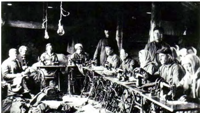
Ув'язнені чоловіки та жінки працюють на механічних швейних машинах у майстерні табору Біломорканалу. 1932 р. 59

і деревину, виготовляли взуття, одяг, столярні вироби, товари широкого вжитку та ін. Комбінат складався з 9-ти відділень, кількість ув'язнених у кожному становила 10–15 тис. осіб, значну частину становили вихідці з України. Відділення комбінату розташовувалися на ділянках траси, так і на окремих Соловецьких островах. Офіційними центрами відділень були табори-містечка з управлінням, радіовузлом і станцією, лазаретом, кладовищем, штабом ударництва з «червоною» і «чорною» дошками, ротою особливого режиму 58 .