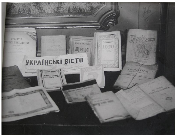
Контрреволюцій література, вилучена під час арештів у Києві 5-6 квітня 1935 р.