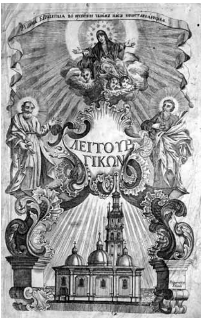
1759, 14 апр. Служебник. Грав. Иван Филиппович