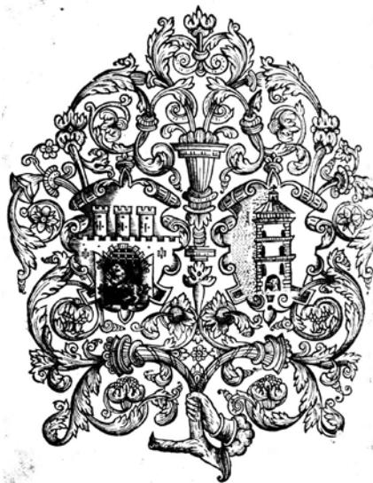
1630. Октоих. Тит. л. Фрагмент рам- ки . Колокольня Корнякта