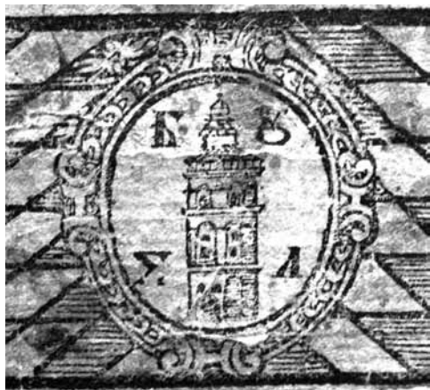
1630. Октоих. Тит. л. Фрагмент рамки . Колокольня Корнякта