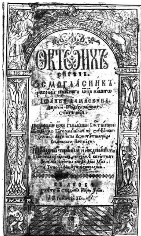
1630. Октоих. Тит. л