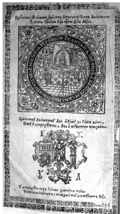
1688. Триодъ цветная. Малая типографская марка