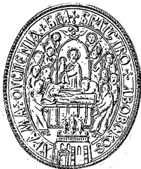
1591. Печати Братства