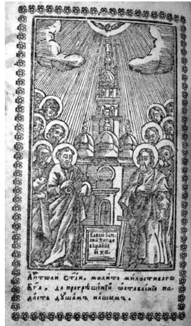
1742. Акафист всеседмичный.