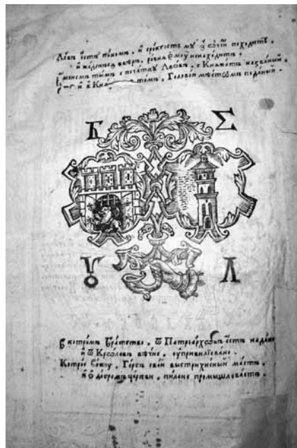
1614. Иоанн Златоуст. О священстве. Малая типографская марка