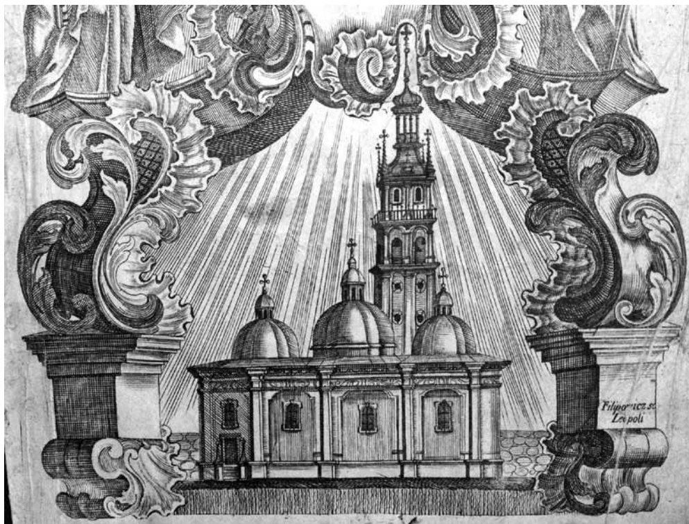
1759, 14 апр. Службник. Грав. Иван Филиппович. Успенская церковь и колокольня Корнякта