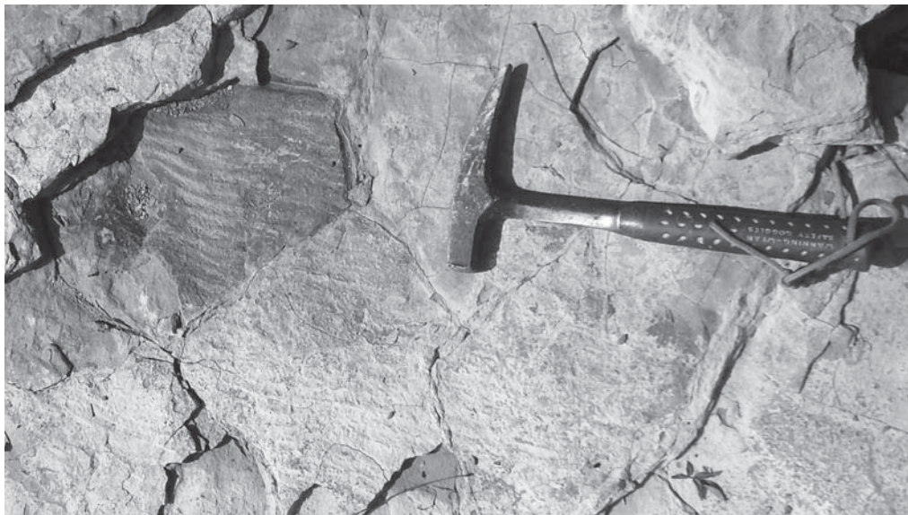
Рис. 4. Дрібні хвилеприбійні знаки у нижній частині канилівської серії (шебутинські верстви данилівської світи). Відслонення на лівому березі Дністра в 2-х км вище устя струмка Данилів.