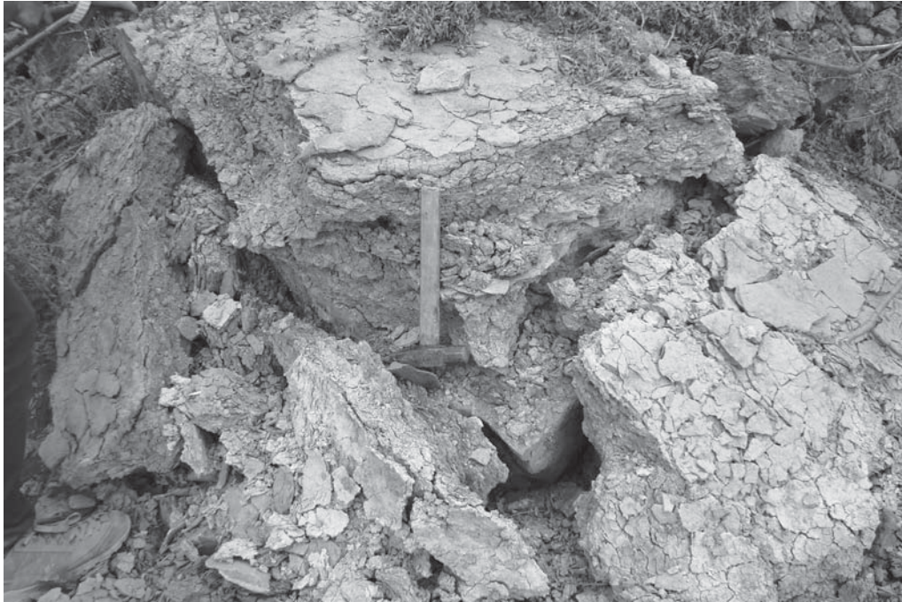
Рис. 1. Бентоніт середньої частини бернашівських верств порушений зсувом. Кар'єр нижче греблі Дністровської ГЕС.