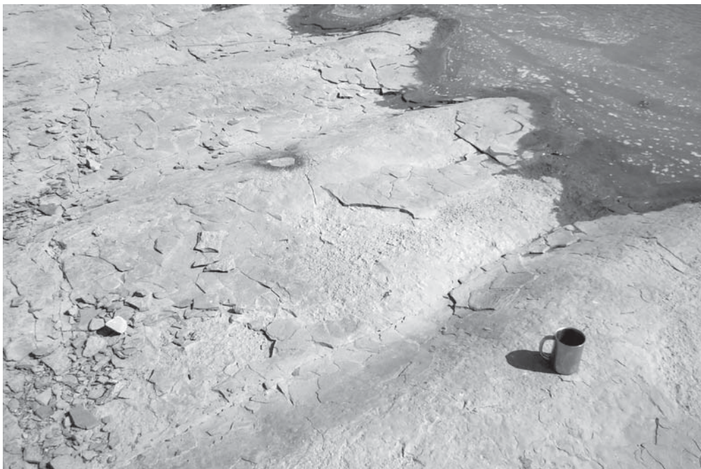
Рис. 3. Брижі течії на поверхні пачки гравелітів ломозівських верств – напрямок потоку південний захід – північний схід (перпендикулярно до краю Українського щита).

2. З огляду на будову венд-палеозойського покрову південно-східної частина схилу Українського щита, вендська формація віддзеркалює початок великого класичного циклу, коли знизу відкладалися теригенні