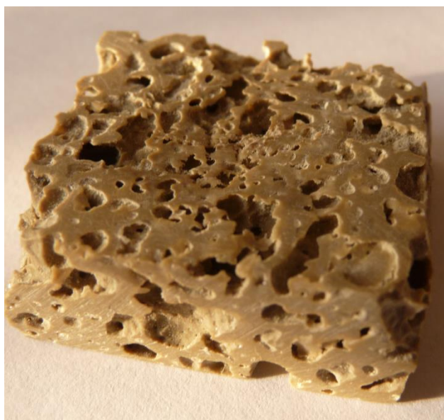
Рис. 1. Образец крупнопористого глинополимерного композита

Для опытов методом термополимеризации были получены образцы крупнопористых глинополимерных композитов (рис. 1), которые в сухом виде содержали бентонита 66,2 %, полиакрилата натрия 26,3%, остальные 7,5 % составляли N,N' – метиленбисакриламид, персульфат аммония, карбонат натрия, акриловая кислота.